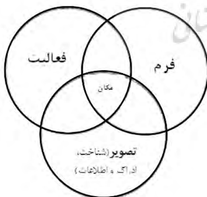
شکل ۱- دیاگرام مولفه‌های شکل‌دهنده مکان

رلف ۱ در مکان و بی‌مکانی، این مفهوم را متشکل از کالبد، فعالیت و معنی دانسته است که دستیابی به معنی بسی مشکل‌تر است (رلف، ۱۳۸۹) و کنتز ۲ نیز با اعتقاد تا حدی مشابه، اعمال، کالبد و مفهوم‌سازی را عوامل شکل‌دهنده مکان بیان می‌نماید (شکل ۱). همچنین رلف مکان را مراکز معنایی از محیط می‌داند که از تجربیات مشخصی شکل می‌گیرد (کرمونا، ۱۳۸۹: ۱۸۹). بواقع رلف با این بیان سعی در روشن کردن تفاوت مکان و فضا دارد و معتقد است با ادغام فضا و معنی افراد بطور مستقل و یا جمعی فضا را به مکان تبدیل می‌کنند. اهمیت مکان تا آنجاست که ریشه‌دار بودن یا حس هویت‌مندی اغلب با حس ناخودآگاه مکان همراه است. با اشاره مختصری به مفهوم مکان و هم‌پیوندی آن با دو مفهوم معنی و هویت به طور مشخص به ارائه نظرهای مختلف در ارتباط با هویت و معنی پرداخته خواهد شد.