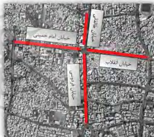
شکل ۱: موقعیت قرارگیری چهار محور مورد مطالعه نسبت به همدیگر و در شبکه ارتباطی شهر

دلیل انتخاب افراد مغازه‌دار به عنوان جزئی از حجم نمونه مورد نظر این بوده است که مغازه‌داران مقیم همیشگی خیابان هستند که ارتباط و اعتماد بین آنها می‌تواند در ارتقاء سرمایه اجتماعی بسیار مهم باشد. همچنین ارتباط غیر قابل انکار میان بازیگران فضا که شامل ساکنان، مغازه‌داران و بازدیدکنندگان از خیابان هستند، تاثیر بسزایی در شکل‌گیری اعتماد و انسجام این سه عضو جدایی ناپذیر فضا خواهد داشت.