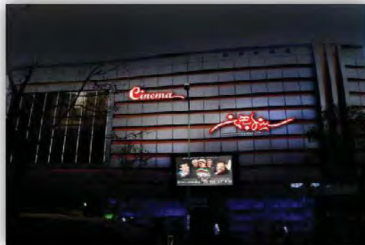
شکل ۶: کاربریهای جاذب جمعیت در خیابان فردوسی

اختلاط کاربری و تنوع فعالیتها در خیابان فردوسی و امام خمینی، سینما بهمن و آبمیوه فروشی و غذاخوری های موجود در این دو خیابان، که باعث جذب اقشار و گروه های