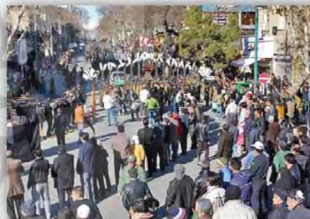
شکل ۱۰: برگزاری مراسم روز عاشورا در خیابان امام خمینی

ارزیابی بعد شبکه از سرمایه اجتماعی را می‌توان با توجه به امکان وجود روابط چهره به چهره در خیابان و مشارکت و انسجام اجتماعی انجام داد. همانطور که از آمار و ارقام مشخص است میزان بعد شبکه در خیابان امام خمینی بیشتر از سایر خیابانها است؛ خیابان امام خمینی به دلیل اینکه میزبان مراسم‌های مختلفی در طول سال است، زمینه مشارکت اجتماعی را در سطح خیابان افزایش داده است. این عاملی است که در خیابان فردوسی و خیابان طالقانی نیز دیده می‌شود.