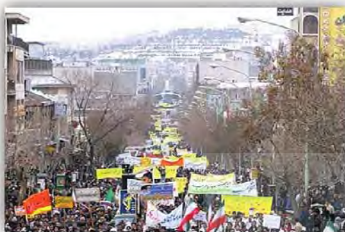
شکل ۱۱: برگزاری راهپیمایی روز ۲۲ بهمن در خیابان فردوسی

به چهره در سطح خیابان پایین می‌آید و در واقع می‌توان گفت که انسجام اجتماعی از بین می‌رود.