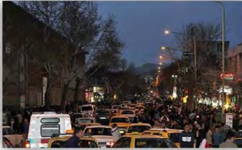
شکل ۳: اختلاط پیاده و سواره در خیابان انقلاب