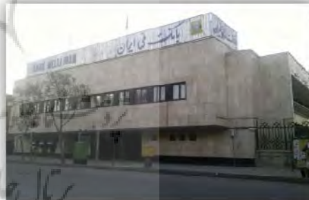
شکل ۷: بناهای فاقد ارزش بصری در خیابان طالقانی