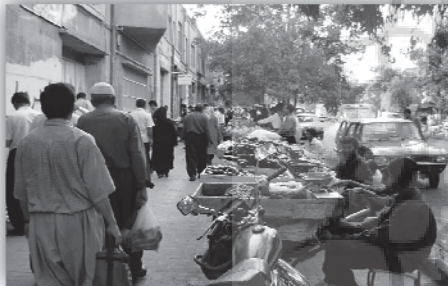
شکل ۵: حضور دستفروشان در خیابان انقلاب

از جمله دلایل دیگری که باعث می شود میزان اعتماد اجتماعی در دو خیابان طالقانی و انقلاب پایین تر از دو خیابان دیگر باشد، گروه های اجتماعی است که از خیابان استفاده می کنند. بیشتر افرادی که در خیابان انقلاب دیده