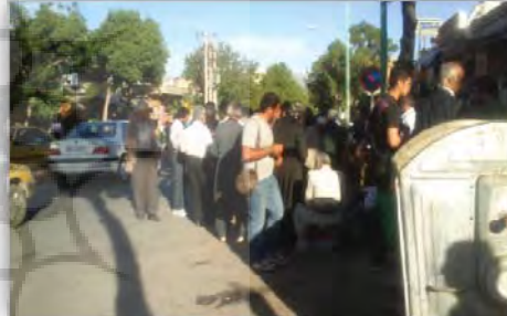
شکل ۴: گروه مردان دلال و دستفروش در خیابان انقلاب

مختلف اجتماعی در طی شبانه روز به خیابان می شود نیز باعث افزایش امنیت خیابان در طول شبانه روز می شود.