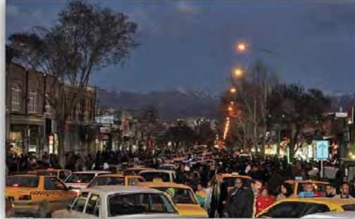
شکل ۲: اختلاط پیاده و سواره در خیابان طالقانی

می شوند مردان دست فروش و دلال هستند که برای خرید و فروش اجناس دست دوم و حتی اجناس دزدی در این خیابان هستند که منجر به پایین آمدن سطح اعتماد می شود.