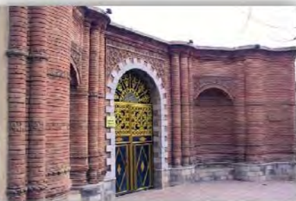
شکل ۹: بناهای شاخص در خیابان امام خمینی