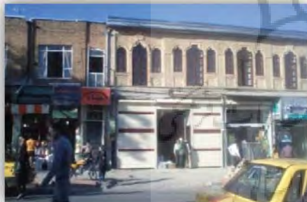
شکل ۸: فرم خاص بدنه‌ها در خیابان انقلاب

با توجه به اینکه بعد هنجار از سرمایه اجتماعی در ارتباط با مسائلی مانند همکاری و همیاری و احساس اثرگذاری و کارایی معنی دار می‌شود، بنابراین میزان کاهش یا افزایش آن را در خیابان می‌توان در رابطه با هویت، حس مکان و تعلق خاطر در خیابان جستجو کرد، در صورتی که خیابان دارای هویت باشد و حس مکان و تعلق خاطر افراد نسبت به خیابان در سطح بالایی باشد، افراد سعی در همکاری و همیاری برای حفظ آن خواهند داشت. هویت‌مندی و منحصر به فرد بودن در یک خیابان منجر به این می‌شود که افراد نسبت به خیابان حس تعلق خاطر داشته باشند و در واقع وجود عناصر شاخص در یک خیابان باعث تقویت حس مکان می‌شود، در نتیجه افراد سعی در حفظ و نگهداری آن در قالب همکاری با یکدیگر و همکاری با مسئولین خواهند داشت و در مورد رسیدگی به خیابان احساس تکلیف خواهند کرد.