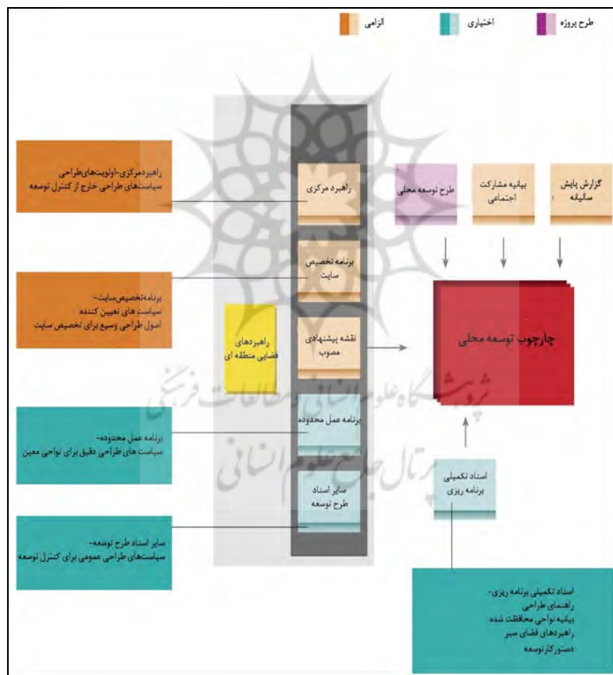
نمودار ۱. جایگاه سیاست های طراحی شهری در فرایند چهارچوب توسعه اجتماعات محلی

اگرچه وجود اسنادی مانند بیانیه مشارکت اجتماعی از جمله مسائل