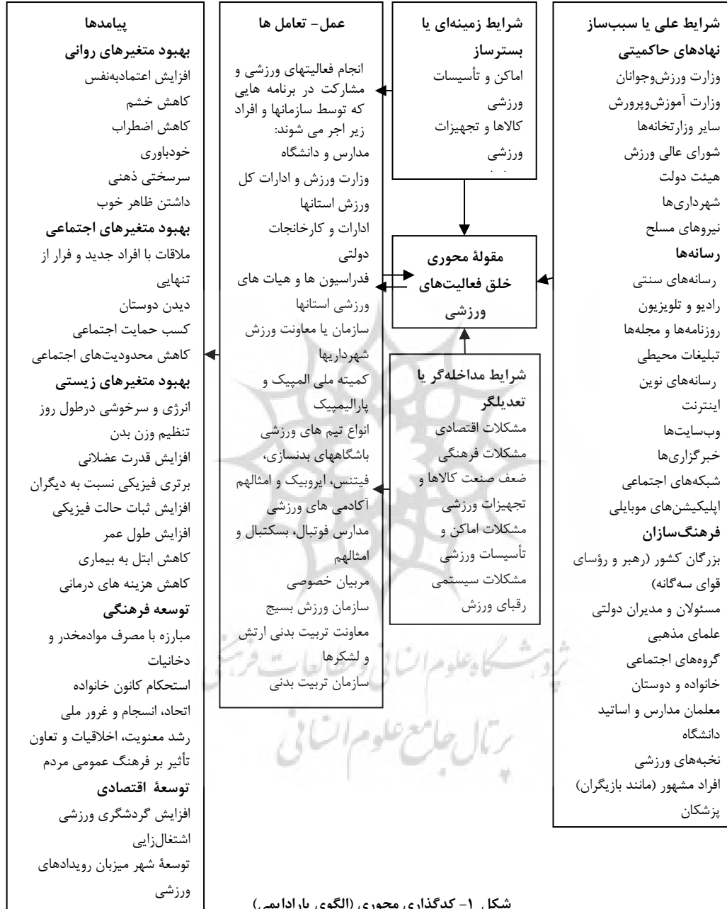
شکل ۱- کدگذاری محوری (الگوی پارادایمی)