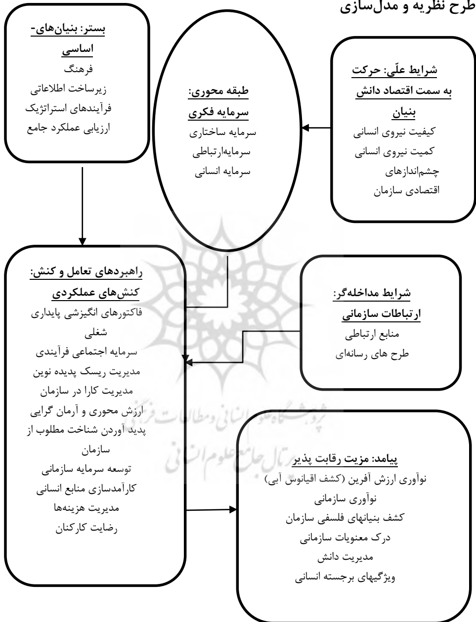
شکل ۲- مدل سرمایه فکری در آجا