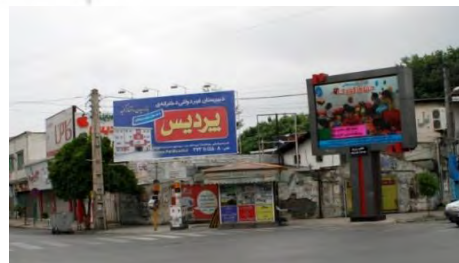
تصویر ۱: چهار راه شهربانی

یکی از مصادیق جانمایی نامناسب تابلوهای تبلیغاتی، قرارگیری آن ها در مکان های نصب علائم مسیریابی و تابلوهای راهنمایی و رانندگی است. جایگیری بیلوردها در کنارعلائم شهری، خوانایی این علائم را تحت الشعاع قرار داده، تمرکز و دید رانندگان را نسبت به آن ها از بین می برد و باعث اختلال در تردد وسایل نقلیه و افزایش ترافیک شهری می شود. (تصاویر ۳ و ۴)