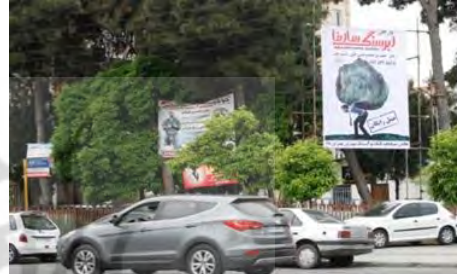
تصویر ۵: خیابان مدرس

در جانمایی تابلو ها باید در نظر داشت از اعتبار تابلوهای دیگر کاسته نشود. تجمع تعدادی تابلو، محدودیت توان خواندن و درک افراد در حین رانندگی را به دنبال خواهد داشت. در تصویر (۷) ابعاد بزرگ بیلپورد نسبت به محیط اطراف و نزدیکی بیش از حد آن به سطح سواره رو و تجمع تابلوها، تداخل دید، عدم تعادل و آشفتگی بصری ایجاد کرده است.