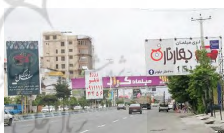
تصویر ۷: بلوار امام رضا، ابتدای امیرکلا