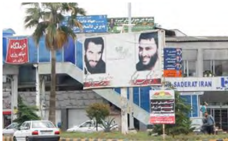
تصویر ۴: میدان کارگر

از نمونه های دیگر تبلیغات که به شکل پراکنده در سطح شهر مشاهده می شود، نصب بنر بر روی داربست فلزی، درخت و یا تیرهای برق است. با توجه به این که محوطه های سبز شهری و فضاهای درختکاری شده جزء چشم اندازهای منظر طبیعی شهر محسوب می شوند؛ بنابراین نصب هر نوع تبلیغی نباید آسیبی به این چشم اندازها وارد نماید. (تصویر ۵) در تصویر (۶) نصب تابلو تبلیغاتی بر فراز ایستگاه تاکسی که کارکرد اصلی آن سرویس دهی خدماتی به شهروندان و بهبود کیفیت منظر شهری است، آن را تنها به یک سازه نامتناسب و ناموزون جهت اهداف تبلیغاتی تبدیل نموده که هیچ گونه هماهنگی با محیط پیرامون خود ندارد.