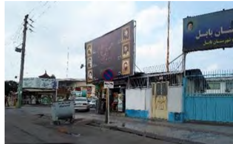
تصویر ۳: میدان ولایت