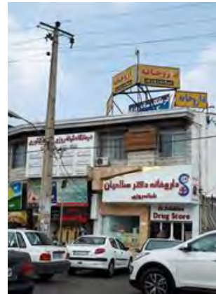
تصویر ۱۰: میدان کشوری