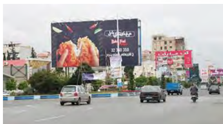
تصویر ۲: بلوار امام رضا، ابتدای امیرکلا

تصویر (۲) نمونه ای از عدم ارتباط تابلو تبلیغاتی با محیط اطراف است. همانگونه که در تصویر مشاهده می شود، تعدد و تراکم سازه های تبلیغاتی و عدم تناسب آن ها از نظر شکل، اندازه، کادر و محتوا و نیز نصب پلاکاردها بر روی تیر برق و داربست فلزی به شکلی ناموزون، همچنین قرارگیری تبلیغات با مضامین متفاوت تجاری، فرهنگی و مذهبی در کنار یکدیگر علاوه بر آن که در امر پیام رسانی اختلال ایجاد نموده، موجب نابسامانی و آشفتگی بصری نیز شده است.