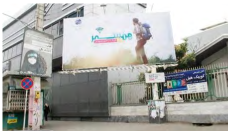
تصویر ۹: خیابان مدرس

در تصویر (۸) فرارگیری دو تابلوی بزرگ تبلیغاتی و یک بنر با فاصله بسیار کم از یکدیگر و نیز عدم تناسب آن ها با عرض پیاده رو و فضای نصب شده، تراکم و ازدحام بصری به وجود آورده است. همان گونه که در تصویر (۹) مشاهده می شود، عدم تناسب سازه از نظر اندازه با محیط اطراف، چیدمان نامناسب تابلوها، نصب بنر بر روی تیر برق و هم جوارگی آن با تابلوی علائم راهنمایی و رانندگی همچنین بقایای آگهی های نصب شده بر روی پایه بیلپورد، همگی بر نادیده گرفتن ضوابط و استانداردهای موجود دلالت دارند.