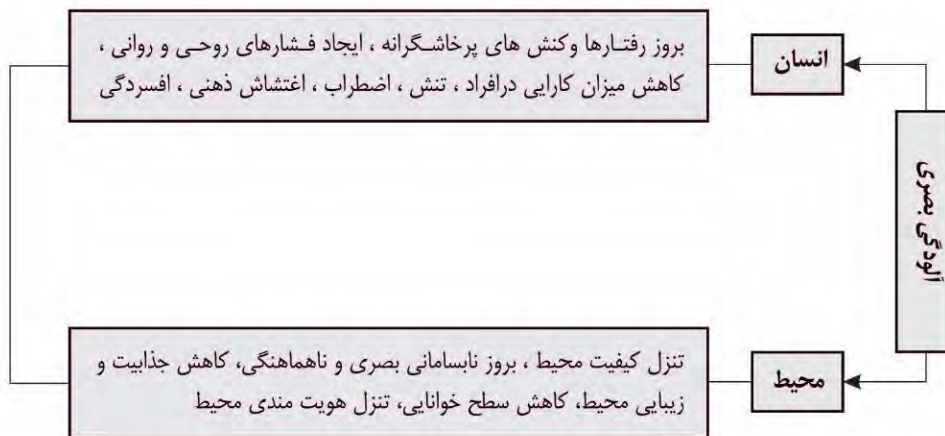
نمودار ۲- تأثیرات آلودگی بصری بر انسان و محیط، (مأخذ: نگارندگان)