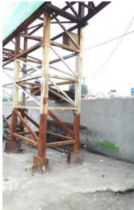
تصویر ۱۲: میدان شهید کشوری

همانگونه که در محث ضوابط تابلوهای تبلیغاتی اشاره شد، دقت در اجرا و نصب فونداسیون سازه تبلیغاتی از مواردی است که نسبت به آن باید کنترل و نظارت بیشتری اعمال گردد. از اصول اجرای فونداسیون پایه سازه‌ها هم سطح بودن سطح روی صفحه فونداسیون با کف معبر می‌باشد در غیر این صورت مشکلاتی برای عابران به وجود خواهد آمد. (تصاویر ۱۱ و ۱۲)