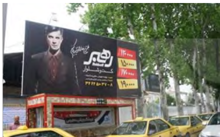
تصویر ۶: میدان حمزه کلا