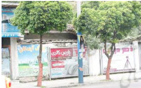
تصویر ۸: خیابان مدرس

در جانمایی تابلو ها باید در نظر داشت از اعتبار تابلوهای دیگر کاسته نشود. تجمع تعدادی تابلو، محدودیت توان خواندن و درک افراد در حین رانندگی را به دنبال خواهد داشت. در تصویر (۷) ابعاد بزرگ بیلپورد نسبت به محیط اطراف و نزدیکی بیش از حد آن به سطح سواره رو و تجمع تابلوها، تداخل دید، عدم تعادل و آشفتگی بصری ایجاد کرده است.