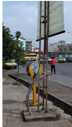
تصویر ۱۱: ابتدای بلوار جانبازان