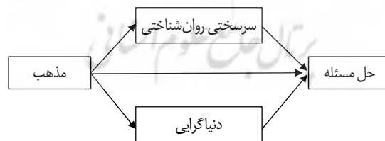
نمودار ۱: مدل مفروض رابطه بین متغیرهای پژوهش