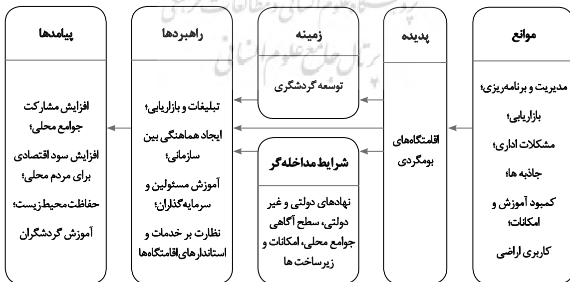
تصویر ۲. مدل پارادایمی پژوهش.

به صورت کلی توسعه گردشگری در چند سال اخیر به عنوان موضوعی پرجاذبه برای مسئولین و مدیران تبدیل شده است و علاقه‌مندی فراوانی را در بین آنان ایجاد کرده است. نهادها و سازمان‌های دولتی و غیردولتی مختلفی نیز در سطح استان گیلان برای حمایت از گردشگری در راستای ایجاد تسهیلات و خدمات مرتبط شکل گرفته یا بسیج شده‌اند. به رغم این همه، ضعف‌های بسیاری مانند، ساماندهی گردشگران انبوه و چادرخواب‌ها در فصول گردشگری استان، روند طرح‌های گردشگری در بازه زمانی بسیار طولانی تهیه می‌شوند و در بسیاری از موارد یا اجرا نمی‌شوند و یا به اهداف موردنظر دست نمی‌یابند که خود در بسیاری از موارد ناشی از ناهماهنگی بین سازمان‌های مختلف