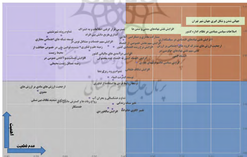
نمودار ۱. عدم قطعیت‌های بحرانی حکمروایی کلان‌شهر تهران