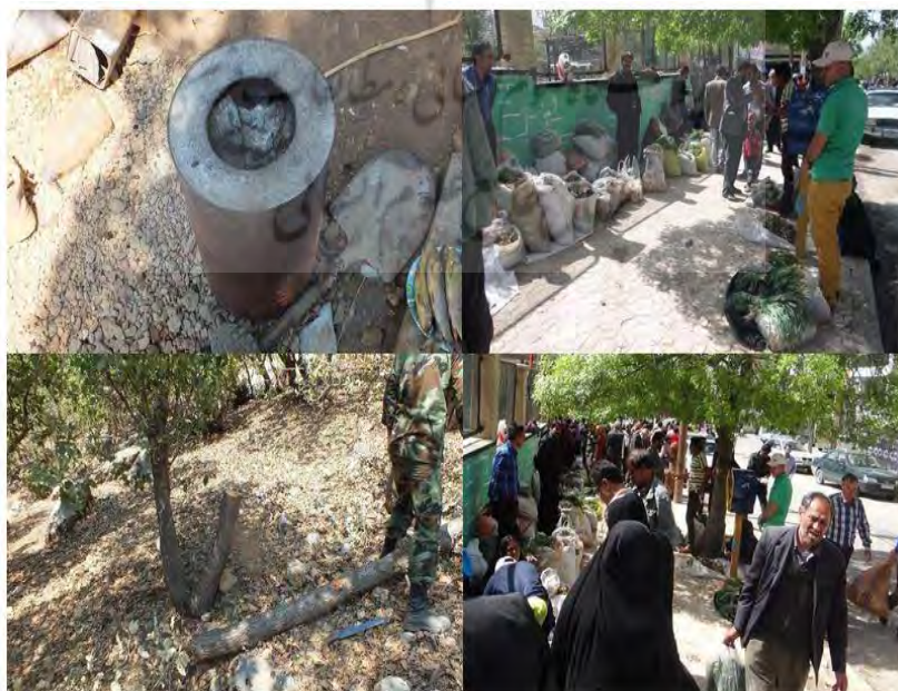
شکل ۲. بهره‌برداری از گیاهان کوهی و تهیه زغال در سکونتگاه‌های مورد مطالعه

تخریب منابع محیط طبیعی در میان ساکنان روستاهای پیرامون شهر یاسوج بیشتر به‌صورت جمع‌آوری گیاهان خوراکی، دامی و طبی است که برای مصرف خانگی و فروش برای کسب درآمد است. یکی از روش‌هایی که با استفاده از آن ساکنان این روستاها خواسته یا ناخواسته سبب تخریب محیط می‌شوند، قطع درختان (برای زغال و پخت‌وپز) است. برداشت بی‌رویه و غیراصولی گیاهان کوهی در کهگیلویه و بویراحمد برای فروش و کسب درآمد بسیاری از این گیاهان بازارش را ریشه‌کن کرده است. به‌نظر می‌رسد فقر اقتصادی خانوارها مهم‌ترین عامل بهره‌برداری بی‌رویه از گیاهان کوهی در روستاهای مورد مطالعه است. از دیگر مواردی که سبب تخریب محیط‌زیست می‌شود، قطع درختان جنگلی برای تهیه زغال است.