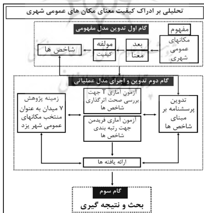
شکل ۱. فرایند پژوهش

هدف این پژوهش، شناسایی شاخص‌های اصلی دخیل در کیفیت معنای مکان‌های عمومی شهر یزد و اولویت‌بندی آنها از منظر شهروندان است. با توجه به این هدف، پرسش این است که شاخص‌های اصلی دخیل در کیفیت معنای مکان‌های عمومی شهر یزد و اولویت‌بندی آنها از منظر شهروندان کدام است؟ روش پژوهش در این مقاله، روش توصیفی-تحلیلی است. این پژوهش در مرحله گردآوری داده، از مطالعات اسنادی بهره برده و در مرحله تحلیل، با توجه به آمار استنباطی، با بهره‌گیری از روش‌های آماری به تحلیل پرسش‌های پرسشنامه پرداخته است. فرایند پژوهش به‌گونه‌ای تنظیم شده که با مروری بر پژوهش‌های پیشین، شاخص‌های کیفیت معنای مکان استخراج شده است و در مرحله بعد، با استفاده از پرسشنامه اهمیت شاخص‌های کیفیت معنا در میدان‌های منتخب از شهروندان پرسش شده است. در این مراحل، از روش پرسش‌گری و تحلیل کمی داده‌ها در محیط نرم‌افزار SPSS استفاده شده است. شکل ۱ فرایند پژوهش را نشان می‌دهد.