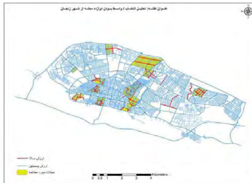
شکل ۷. تحلیل انتخاب / واسط بودن شهر زنجان (R: 3) (قرمز: ارزش زیاد، آبی: ارزش کم)

بیکربندی فضایی در دو مقیاس محلی و فرامحلی (شهری) تحلیل شد تا محله‌ها نه تنها نسبت به زمینه وسیع‌تر و محدوده تحت تأثیر خود (محله‌های مجاور و کل منطقه) بررسی شوند، بلکه به لحاظ معیارهایی چون دسترسی فضایی و توزیع منابع و فرصت‌های کار و زندگی نسبت به شهر نیز، به مثابه یک کل، سنجیده شوند.