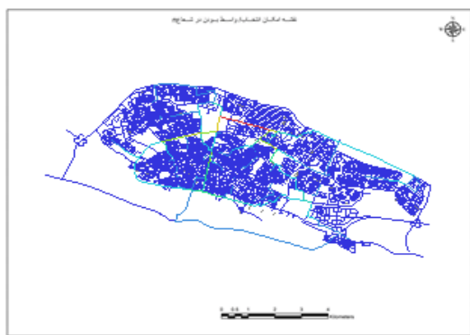
شکل ۸. تحلیل امکان انتخاب / واسط بودن شهر زنجان (R: n) (قرمز: ارزش زیاد، آبی: ارزش کم) (منبع: نگارندگان)