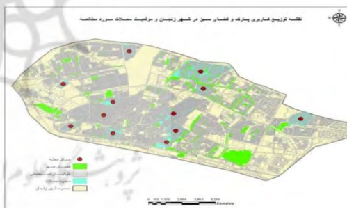
شکل ۳. توزیع کاربری پارک و فضای سبز در شهر زنجان و موقعیت محلات مورد مطالعه شکل ۴. توزیع کاربری آموزشی در شهر زنجان و موقعیت محلات مورد مطالعه