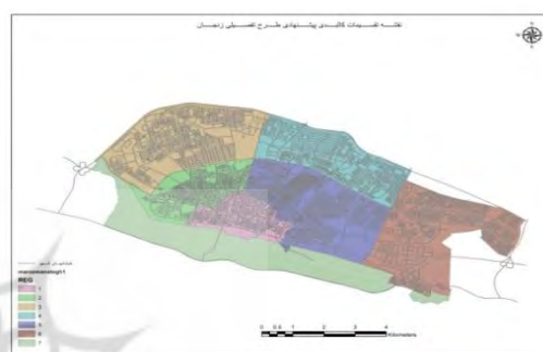
شکل ۱. تقسیمات کالبدی پیشنهادی طرح تفصیلی زنجان / شکل ۲. درجه‌بندی معابر شهر زنجان