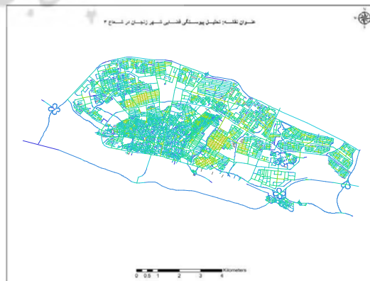
شکل ۹. تحلیل پیوستگی فضایی شهر زنجان (R: 3) (قرمز: ارزش زیاد، آبی: ارزش کم)