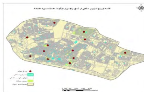
شکل ۵. توزیع کاربری مذهبی در شهر زنجان و موقعیت محله‌های مورد بررسی شکل ۶. توزیع کاربری تجاری در شهر زنجان و موقعیت محله‌های مورد بررسی