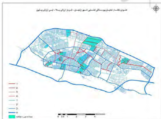
شکل ۱۰. تحلیل پیوستگی فضایی شهر زنجان (R: n) (قرمز: ارزش زیاد، آبی: ارزش کم)

مناطق ۱، ۲ و محله نجف‌آباد واقع در منطقه ۵ که جزو سکونتگاه‌های غیررسمی‌اند، بافتی متراکم و ریزدانه دارند؛ در حالی که بافت مناطق ۳، ۴، ۵ (محله‌های دیگر) و منطقه ۶ پراکنده و درشت‌دانه است و در مقیاس شهری نسبت به دیگر مناطق، پیوستگی بیشتری دارند. براساس شکل ۷ و ۸ که ارتباطات بین مرکز و پیرامون را نشان می‌دهند و مسیرها را براساس قابلیت‌شان در جذب حرکت بیشتر ارزش‌گذاری می‌کنند، محله‌های واقع در مناطق ۳ و ۶ به لحاظ فضایی بیشتر از شهر (به مثابه یک کل) مجزا شده‌اند. دسترسی به منابع شهری برای ساکنان آنها محدود است و ساکنان در محیط محلی‌شان از منابع و خدمات کمتری بهره‌مندند. مراکز در این محله‌ها نه پیوستگی زیاد و نه ارزش واسط بودن دارند؛ بنابراین به طور ضعیف در محدوده بلافاصله‌شان جای گرفته‌اند. این مراکز درون شبکه پیش‌زمینه (عمدتاً مسکونی) قرار گرفته‌اند که ویژگی‌های فضایی از زندگی و فعالیت اقتصادی و اجتماعی در آنها به طور ضعیفی حمایت می‌کنند. بسیاری از فضاها از لحاظ فضایی، پیوستگی ضعیفی دارند. مناطق محدوده فضایی، دسترسی محدود و واسط پیوستگی (بررسی همزمان و همبستگی مقیاس محلی و فرامحلی) ضعیفی دارند؛ درحالی‌که آنچه در سطح محله برای افراد محلی و حتی غیرمحلی، تأمین‌شدنی است، متأثر و وابسته به آن چیزی است که در زمینه وسیع‌تر محله یافت می‌شود.