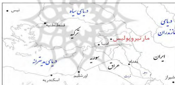
شکل (۱): موقعیت جغرافیایی شهر مارتیروپولیس

شهر مارتیروپولیس که جزو اقلیم پنجم از اقلیم هفت‌گانه قرار گرفته است ۲ ، در دیار بکر واقع شده است؛ چنان‌که در منابع اوایل اسلامی آمده است: