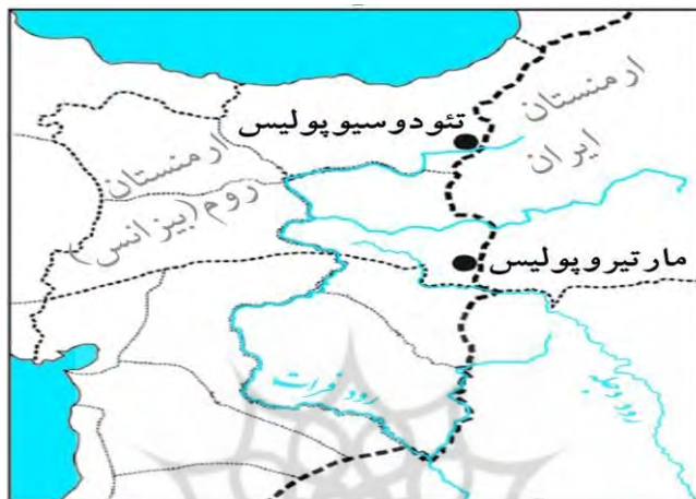
شکل (۳): مارتیروپولیس پس از تقسیم ارمنستان میان ایران و روم

موردحمله قرار می‌دادند. در این رابطه به رویدادهای تاریخی پرداخته‌شده که چنین مدعا را تأیید می‌کنند: