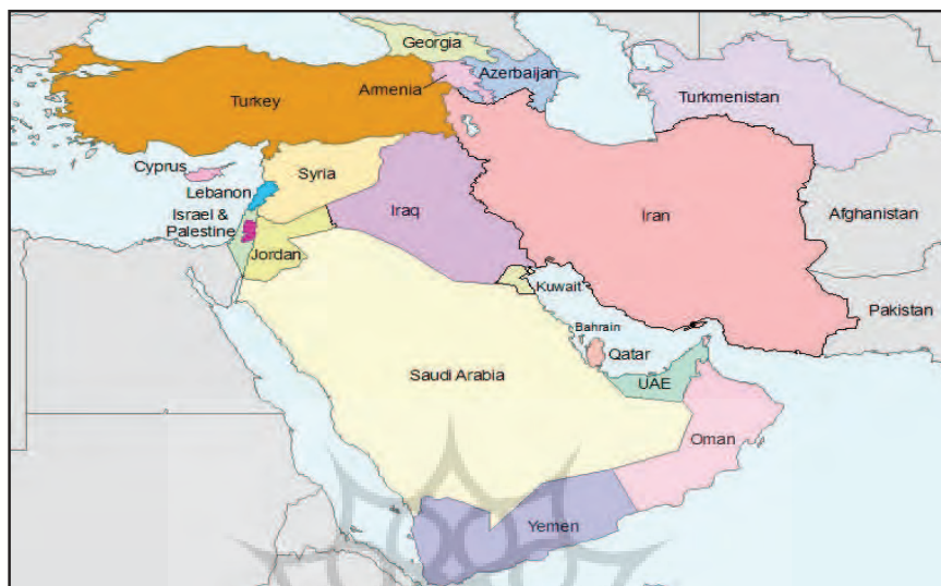
نقشه شماره ۱: منطقه آسیای جنوب غربی

بر اساس این نقشه آسیای جنوب غربی منطقه‌ای از شمال شبه قاره هند، آسیای میانه، قفقاز، آسیای صغیر، منطقه خلیج فارس و بخش عمده خاورمیانه به معنای مصطلح آن را در بر می‌گیرد. این نگاهی است که حتی در برخی برنامه‌های بهداشتی و مهاجرتی سازمان ملل متحد نیز وجود دارد (Macforlane, 2008). اما در بعضی از متون رسمی تر و حتی اطلاعات دایره‌المعارفی مناطق آسیای میانه و قفقاز و پاکستان و افغانستان و همچنین شمال آفریقا در منطقه آسیای جنوب غربی تعریف نشده و آسیای جنوب غربی تنها به منطقه ایران، بخشی از خاورمیانه به معنای کلاسیک و شبه جزیره حجاز و حوزه خلیج فارس اطلاق می‌شود. نقشه شماره ۲ نقشه حوزه جغرافیایی است که در این متون رسمی به عنوان آسیای جنوب غربی خوانده می‌شود.