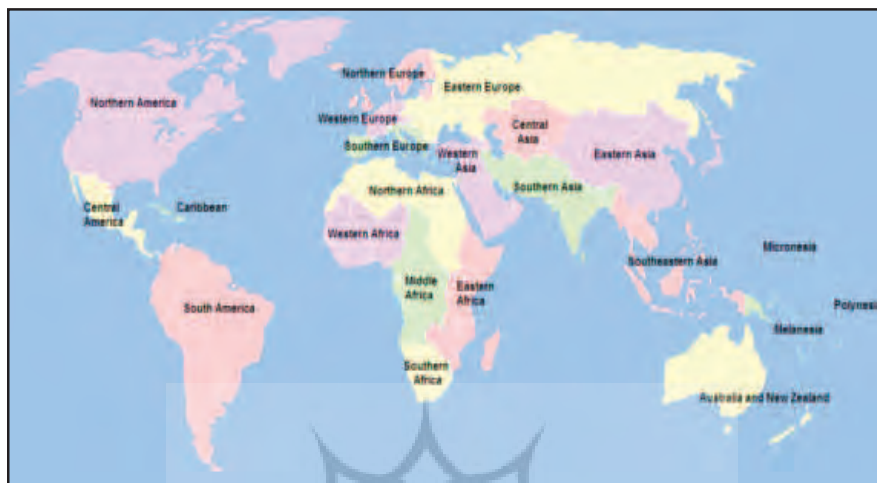
نقشه شماره ۳: مناطق جغرافیایی جهان

بنابراین در میان اسناد و منابع موجود سه تعریف و حوزه جغرافیایی متفاوت به آسیای غربی یا آسیای جنوب غربی استناد داده می‌شود. حال ابتدا باید روشن شود که منظور ما از منطقه آسیای جنوب غربی کدام یک از این تعابیر است؟ و سپس روشن شود که آیا می‌توان شرایط چهارگانه شکل‌گیری یک منطقه را در مورد آن به کار برد یا خیر؟ با توجه به این که در برخی از مراکز و مباحث داخل ایران تلاش زیادی برای تعریف موسع از آسیای جنوب غربی انجام شده، به دنبال روشن کردن این نکته هستیم که آیا آسیای جنوب غربی به معنای موسع آن یک منطقه بالقوه است که طبیعتاً می‌تواند مبنای منطقه‌گرایی و یا منطقه‌سازی شود و یا این امر مستلزم پذیرش انگاره‌ها و پیش‌فرض‌هایی است که بدون آنها شکل‌گیری این منطقه امکان‌پذیر نمی‌باشد؟