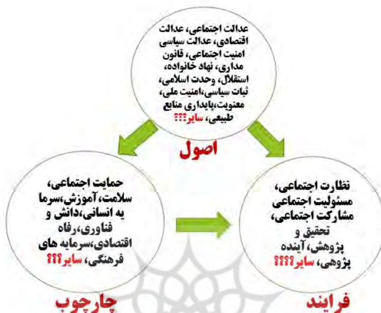
شکل ۲ - مؤلفه‌های اصلی هریک از ابعاد اصلی الگوی اسلامی - ایرانی پیشرفت