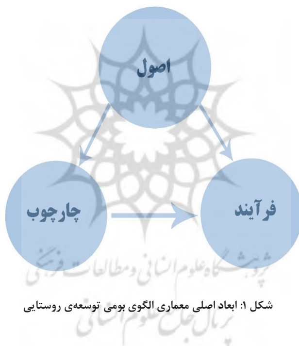
شکل ۱: ابعاد اصلی معماری الگوی بومی توسعه‌ی روستایی

معماری الگوی اسلامی - ایرانی (بومی) پیشرفت و توسعه‌ی روستایی شامل مجموعه‌ای از اصول، چارچوب و فرایند است. اصول شامل مبانی و زیربنای فکری، فلسفی، و تجربی معماری الگوست. چارچوب شامل مجموعه‌ای از عوامل و عناصر زیربنایی و ترتیبات سازمانی و نهادی برای طراحی، اجرا و نظارت است. این عناصر شامل مأموریت‌ها، اهداف، راهبردها، سیاست‌ها، و نیز ترتیبات سازمانی و نهادی لازم است. فرایند نیز شامل کاربرد سیاست‌ها، اقدامات و فعالیت‌ها در زمینه‌های ارتباطی، مشاوره‌ای، زمینه‌سازی و تحلیل، سنجش و ارزیابی و نظارت است.