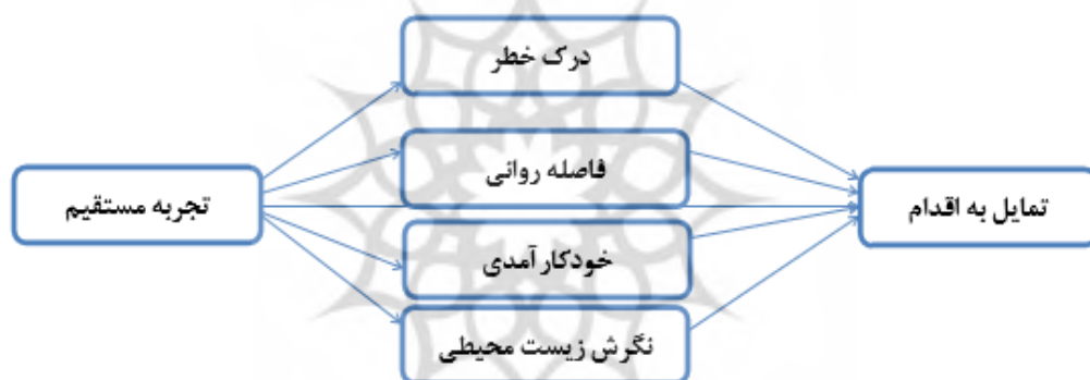
شکل (۱). الگوی علی تعیین روابط بین عوامل مؤثر بر تمایل به اقدام جهت کاهش تغییرات اقلیمی

زمانی در (ذهن) یک فرد در ارتباط است. این تئوری بین فاصله روانی درک شده با تفسیر ذهنی از حوادث رابطه برقرار می‌کند. از آنجا که نیت عمومی برای انجام یک رفتار مثلاً "من قصد دارم اقداماتی برای متوقف کردن گرمایش جهانی انجام دهم" منعکس کننده سطح بالاتری از انتزاع هستند و برای فرد بیشتر جنبه روانی دارند؛ هنگامی که در مورد گرمایش جهانی در سطح انتزاعی فکر می‌شود، افراد بر روی تصویری بزرگتر و ویژگی‌های اصلی این پدیده که یک نمای کلی از وضعیت را ارائه می‌دهد، متمرکز می‌گردند. اما در مقابل نیت در مورد اقدامات خاص مانند (من سعی دارم که کمتر از تهویه کننده‌های هوا در تابستان و گرم کننده‌های هوا در زمستان استفاده کنم) منجر می‌شود مردم بر روی جزئیات گرمایش جهانی تمرکز کنند، به گونه‌ای که تجربیات شخصی برجسته‌تر می‌گردد (برومل و همکاران، ۲۰۱۵؛ ۶۸). از این رو، انتظار می‌رود تجربه شخصی فاصله روانی را و همچنین فاصله روانی تمایل یا نیت افراد را در مورد اقدامات خاص جهت کاهش تغییرات اقلیمی تحت تأثیر قرار دهد. شکل (۱) الگوی علی پیشنهادی جهت تعیین روابط بین عوامل مؤثر بر تمایل به اقدام جهت کاهش تغییرات اقلیمی را نشان می‌دهد.