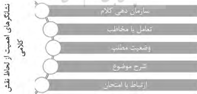
شکل ۲. نشانگرهای اهمیت از لحاظ نقش کلامی

جدول (۴)، بسامد این نشانگرها را از نظر نقش کلامی نمایش می‌دهد.