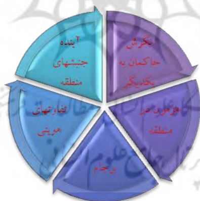
شکل ۴- پیش‌رانه‌های نهایی میک‌مک

پ- حالات احتمالی بر هر یک از عوامل کلیدی، در افق ده ساله آتی در این مرحله باید برای هر یک از این عوامل، حالات احتمالی (آینده) پیش‌بینی گردد.