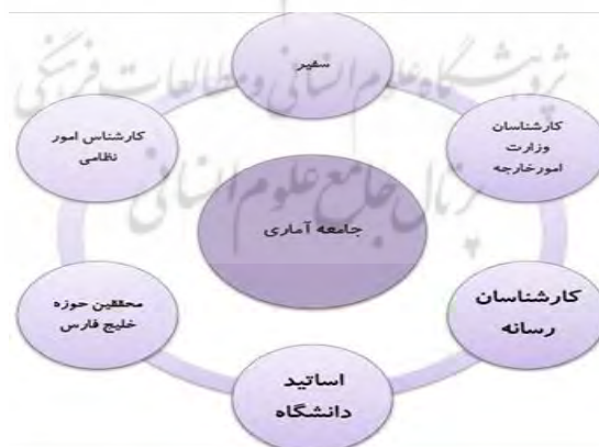
شکل ۱- فراوانی جامعه آماری پژوهش

جامعه آماری این مقاله شامل تعداد ۳۰ نفر از کارشناسان موضوع روابط بین‌الملل و آشنا به مسائل حوزه خلیج فارس است که عمده این افراد دارای مدرک تحصیلی دکترا بوده و در چندین مرحله از جمله سه مرتبه در دلفی، دو مرتبه در میک‌مک و سه مرتبه در سناریو ویزارد به صورت پانل خبرگی و مصاحبه‌های نیمه باز به این افراد مراجعه شده است.