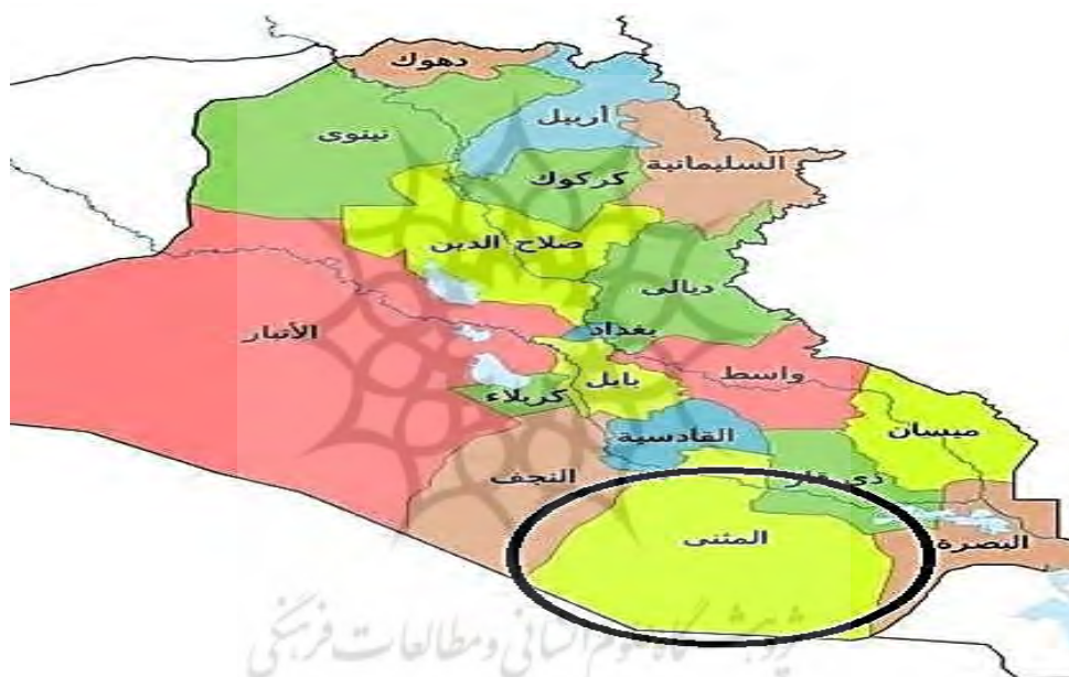
نقشه ۱: جایگاه ژئواستراتژیک استان المثنی برای سرمایه‌گذاری سعودی‌ها در طرح‌های توسعه‌ای جریان صدر