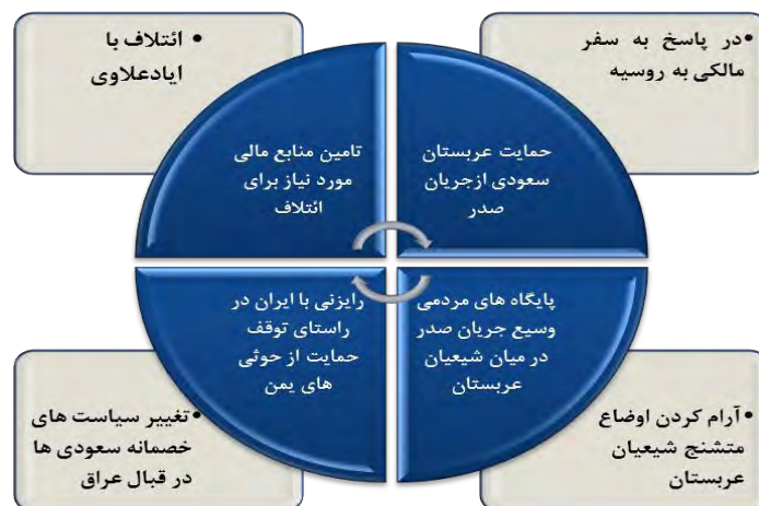
شکل (۲): تحلیل دلایل سفر مقتدی صدر به عربستان سعودی و دیدار با محمد بن سلمان

درخواست سعودی‌ها از صدر برای رایزنی با جمهوری اسلامی ایران برای توقف حمایت از حوثی‌ها در جنگ یمن باشد (Mostafa, 2017, pp.3-4).