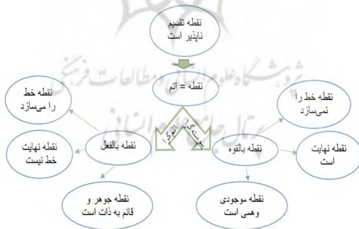
رسم توضیحی ۴. تقابل مفهوم نقطه در دو نظریه

فخر رازی، سخن ارسطو را در اینکه هر بعد قابل تصویری در ذهن تقسیم می‌پذیرد را رد نمی‌کند. او می‌پذیرد که هر بعدی که ذهن تصور شود قابل تقسیم شدن است، اما آنچه نمی‌پذیرد این است که ذهن انسان بتواند به شکل نامحدود هر بعدی خردی را تصور کند. او استدلال می‌کند که ذهن ما در تصور کوچک‌ها محدود است و تا جایی را قادر به تصور هستیم. در واقع تفاوت دیدگاه فخر رازی و ارسطو در این مسئله تفاوتی معرفت‌شناختی است تا جدلی و استدلالی. او با دامن زدن به شکاکیت ۲۶ در مورد مفهوم اتم، آن را از حوزه استدلال خارج کرده است. (Eftekhari 2017) تقابل دو دیدگاه درباره نقطه و طول را می‌توان در نمودار زیر خلاصه نمود.