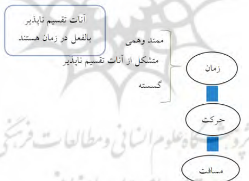
رسم توضیحی ۳. زمان در نظریه اتم‌گرایی

پس تا اینجا می‌توان پارادایم نظریه حرکت فخر رازی را در تقابل با نظریه مشائیان چنین ترسیم کرد.