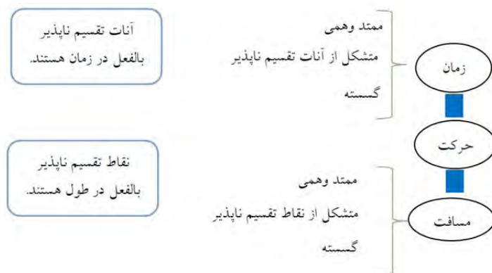
رسم توضیحی ۵. نمودار زمان-مسافت اتم‌گرایی