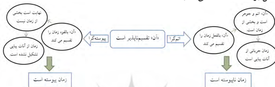
رسم توضیحی ۳. تقابل مفهوم «آن» در دو نظریه

تا اینجا دیدیم که فخر رازی، اصل انطباق مشائیان را پذیرفته است. این را هم پذیرفته که ماضی و مستقبل، در حال حاضر ناموجودند، زمان اگر بخواهد پیوسته باشد، باید «آن» وجود بالفعل نداشته باشد. ولی از آنجا که قیدی برای پیوستگی زمان ندارد و مفهوم امتداد پیوسته زمان را امری موهومی می‌داند، به سادگی گسستگی زمان را پذیرفته و بر بالفعل بودن «آن» صحه می‌گذارد.