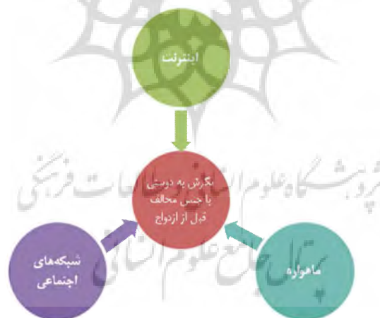
نمودار ۱- مدل نظری پژوهش

بر افراد، متغیرهای بسیاری دخیل می‌شوند که از آن میان خود رسانه و این‌که رسانه چه قابلیت‌هایی دارد، اقبال عمومی آن در نزد مخاطب چگونه است، گستره و پوشش آن تا چه اندازه باشد، محتوای رسانه و ویژگی‌های شخصیتهای، خانوادگی، اجتماعی و فرهنگی مخاطب اهمیت بسیار دارد. می‌توان گفت تأثیر رسانه از یک‌سو به محتوای رسانه بستگی دارد و از سوی دیگر به ویژگی‌های مخاطب که خود در یک فضای فرهنگی و اجتماعی خاص قرار داد. به عبارت کامل‌تر، ویژگی‌های درون‌فردی ۱ (ارزش‌ها و اعتقادات، جنسیت و ضریب هوشی) و برون‌فردی ۲ مخاطبان (نیازها، علایق، روابط اجتماعی و محیط خانوادگی) بر روی دسترسی مخاطب به رسانه‌ها و محتوای آن‌ها و انتظار مخاطب از رسانه تأثیر می‌گذارد (ویندال، ۲۸۱: ۱۳۸۷-۲۸۳). از این رو قابل‌انتظار است محتوای فناوری‌های نوین ارتباطی که عمدتاً نگاهی لیبرال به مسائل جنسیتی خصوصاً مسئله دوستی با جنس مخالف دارند به‌نوعی مروج نگرش‌های لیبرال به این موضوع باشند.