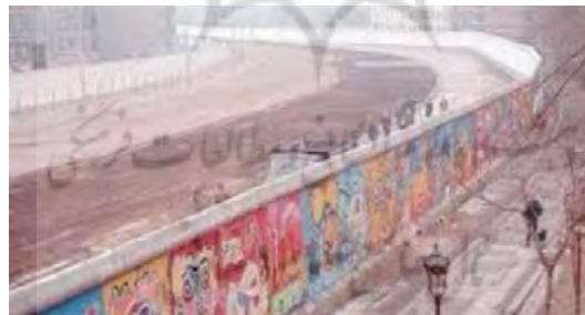
تصویر ۱ گرافیتی‌های طراحی شده دیوار برلین؛ آلمان

امروزه در جهان، گرافیتی به عنوان یک هنر شناخته شده و کتاب‌های مصور زیادی درباره‌ی آن منتشر شده است. دیوار برلین که بعدها خراب شد یکی از مستندترین نمونه‌های گرافیتی جهان است؛ دیواری که بعد از تخریب، تکه‌هایی از آن به موزه‌ها رفت و به قیمت‌های بالا خرید و فروش شد (شایگان، ۱۳۸۰: ۴۹).