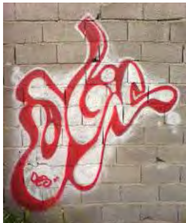
تصویر ۱۱ گرافیتی با سبک تروآپ در تهران

تروآپ: در این نوع گرافیتی، ابتدا دور حروف رنگ می‌شود و سپس به سرعت داخل آن با رنگی متفاوت پرخواهد شد. این روش کمی پرکارتر از تگ کردن است و معمولاً با دو یا سه رنگ کشیده می‌شود. ولی همان طور که اسمش مشخص است، این کار باید در نهایت سرعت انجام بگیرد. این روش هم بیشتر برای نشان دادن هویت فرد یا گروه و اکثراً با حروف حبابی شکل که با یک رنگ متفاوت دورگیری شده استفاده می‌شود (کوثری، ۱۳۸۸: ۶۳).