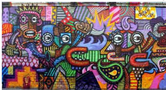
تصویر ۱۴ گرافیتی در شهرک اکباتان اثر (تنها) نوشته تنها با سبک بلوک بوستر

بلوک بوستر: این سبک فضای کاری زیادی رو به خود اختصاص می‌دهد. در واقع یک بلوک را اشغال می‌کند. دیوار نویسی بلوکی به علت حجم کاری، زمان زیادی می‌طلبد در نتیجه نسبت به دیگر کمتر کار می‌شود.