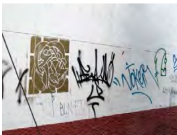
تصویر ۹ امضای به روی دیوار اکباتان

اطلاعات در مورد دیگر شهرهای ایران نیز برای هیچ‌گونه داوری کافی نیست. درباره رابطه جنسیت و گرافیتی نیز تحقیقی صورت نگرفته است. با این حال، به نظر می‌رسد که این هنر بیشتر پسرانه است تا دخترانه، اگرچه نمونه‌هایی از فعالیت دختران گرافر نیز به چشم می‌خورد. به سبب پیوند این نوع فعالیت با فرهنگ زیرزمینی، فعالیت دختران در این هنر چندان آشکار نیست. در ایران دیوارنگاری به دو دسته بخش می‌گردد: دیوارنگاری مردمی و دیوارنگاری حکومتی. دیوار نویسی‌های مردمی به دو دسته تقسیم می‌شود. تبلیغاتی و پیاده سازی طرح‌ها و اشکالی تقریباً جذاب. دسته نخست بیشتر گویای مسائل سیاسی روز مخالفت با سامانه حاکم و یا تبلیغات مشاغل و آگهی‌هاست. دسته دوم در خدمت تبلیغات عقیدتی حاکم و نمایان ساختن برنامه‌های ایدئولوژیکی حکومت فعلی است (همان، ۱۴۵). گرافیتی‌های به‌کار رفته در ایران، به سبب محدودیت‌های اجتماعی و انتظامی موجود، متنوع نیستند و هنوز تجربه خود گرافرها هم در این زمینه چندان نیست و معمولاً در جاهایی خلق می‌شود که اجازه برای کارهای گرافیتی باشد. ناگفته نماند که در همه جا بسیاری از مردم کشیدن گرافیتی را عملی زشت و ناهنجار می‌دانند و آن را از مظاهر آناارشیسم و اوباشگری (وندالیسم) بر می‌شمارند. به نظر می‌آید علت دشمنی افراد با گرافیتی نداشتن سواد و دست کم حوصله لازم برای مواجهه با وضعیتی جدید در محیط پیرامون است. این افراد و شاید اکثریت مردم نقاشی روی دیوار را سرزده از کار یک ولگرد یا بخشی از یک فعالیت سیاسی می‌بینند (کوثری، ۱۳۸۳: ۸۵).