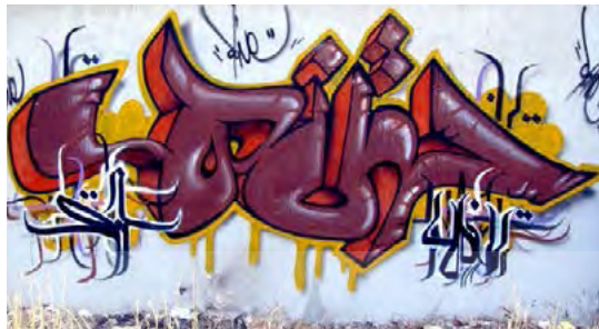
تصویر ۱۵ گرافیتی در شهرک اکباتان اثر (تنها) نوشته تنها با سبک استایل با مضمون اجتماعی

ویلد استایل: این سبک یکی از قدیمی‌ترین سبک‌های گرافیتی است که اولین بار در خیابان‌های شهر نیویورک مشاهده شد. این روش یکی از پرکارترین و دقیق‌ترین روش‌های گرافیتی محسوب می‌شود و اگر بیننده با آن آشنا نباشد شاید حتی نتواند نوشته آن را بخواند. این سبک شامل فلش‌ها، گل‌ها، فرم‌های خمیده و اشکالی است که یک هنرمند غیرگرافیتی‌کار، شاید به سادگی آن‌ها را درک نکند. این سبک معمولاً به شکل سه بعدی اجرا می‌شود.