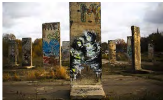
تصویر ۲ بقایای آثار گرافیتی روی دیوار برلین که قطعه‌هایی از آن مورد مشاهده است

امروزه در جهان، گرافیتی به عنوان یک هنر شناخته شده و کتاب‌های مصور زیادی درباره‌ی آن منتشر شده است. دیوار برلین که بعدها خراب شد یکی از مستندترین نمونه‌های گرافیتی جهان است؛ دیواری که بعد از تخریب، تکه‌هایی از آن به موزه‌ها رفت و به قیمت‌های بالا خرید و فروش شد (شایگان، ۱۳۸۰: ۴۹).