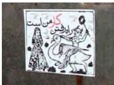
تصویر ۱۲ گرافیتی با سبک استیکر در تهران

استیکر (برچسب): استیکرها آثاری اند که ابتدا بر روی برچسب‌ها آماده و سپس بر روی سطوح مورد نظر چسبانده می‌شوند. اهمیت کار استیکر در سرعت عمل آن است. در محیط‌هایی که امکان جریمه یا دستگیری توسط پلیس یا دیگر کارگزاران نظام سیاسی وجود دارد، استیکرها راه حلی سریع برای انجام کارند. این روش شاید سریع‌ترین روش گرافیتی باشد زیرا باید طرح گرافیتی‌ای که فرد در خانه طراحی و چاپ کرده روی محل مخصوص چسبانده شود.