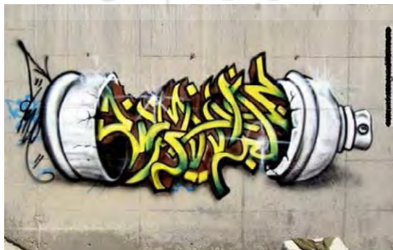
تصویر ۷ گرافیتی جرم نیست به روی دیوارهای شهرک اکباتان

در بهمن ماه سال ۱۳۸۶ شمسی، نخستین جشنواره گرافیتی با عنوان «بمب در پیاده روی فرهنگی» از طرف جمعی از گرافرهای ایرانی در تهران برگزار شد. در این جشنواره نزدیک به ۱۸۰ استیکر (برچسب) از هنرمندان معروف گرافیتی در کشورهای گوناگون دنیا به ایران ارسال شد و به همراه برچسب‌هایی از گرافرهای ایرانی در اماکن عمومی نظیر میدان ونک و چهار راه ولیعصر چسبانده شد. در عبارتی که طرز تلقی جوانان نسبت به «نقاشی جرم نیست» در یکی از گرافیتی‌های تهران آمده است، با عنوان این هنر بیان شده است. این گرافیتی درست بر روی دیواری ایجاد شده که بر روی آن با نوعی استنسیل از سوی اماکن قانونی نوشته شده است که نصب هرگونه آگهی و یا نقاشی دیواری ممنوع است و تعقیب قانونی دارد! این نمونه‌ای از همان تلقی در این باره است که چگونه فضا به محلی برای نمایش تعارض در می‌آید. از سویی این فضا متعلق به حکومت است و حق دارد که نوشتن بر روی آن را به هرکسی که می‌خواهد واگذار کند. و از دیگر سو، جوانانی هستند که این دیوار را متعلق به خود می‌دانند و تلاش می‌کنند که آن را به مثابه بخشی از فضای زندگی روزمره خود نشان دهند (کوثری، ۱۳۸۳: ۱۳۸).