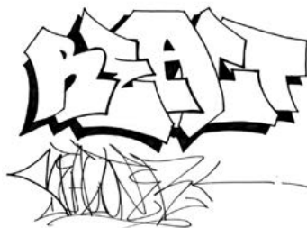
تصویر ۱۰ نمونه غربی