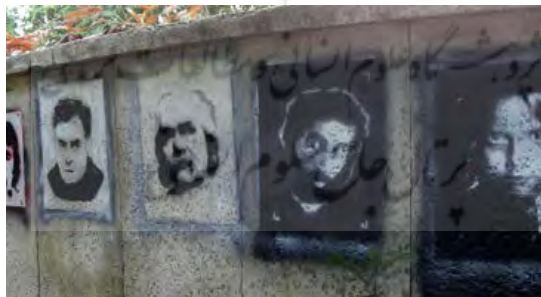
تصویر ۱۳ گرافیتی استنسیل بر دیوارهای دانشگاه علمی کاربردی لارستان

استنسیل: نمونه‌های استنسیل از ابتدای انقلاب تا کنون رایج بوده است. استنسیل هم از لحاظ سرعت عمل و هم قابلیت تکثیر از نمونه‌های سریع گرافیتی به شمار می‌رود. این روش از گرافیتی چیزی است که آن را می‌توان به تمام معنا یک هنر دانست. استفاده از شابلون راهی موثر و سریع برای اجرای نقوش پیچیده است. تنها کاری که باید انجام بدهید، این است که شابلون را جلوی دیوار بگیرید و اسپری کنید. نتیجه طرحی است که جزئیات آن را شاید با ساعت‌ها صرف کردن هم نمی‌توان به دست آورد. البته روش پیشرفته‌تر این است که شما از چند شابلون استفاده کنید و آن‌ها را به ترتیب روی هم بگذارید تا یک شاهکار خلق کنید.