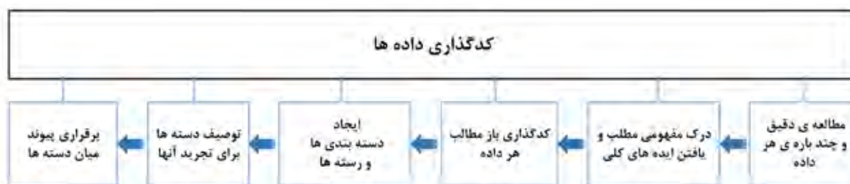
تصویر ۱. کنش های مرحله کدگذاری داده های کیفی. مأخذ: نوروز برازجانی، ۱۳۹۷، ۲۶۲.