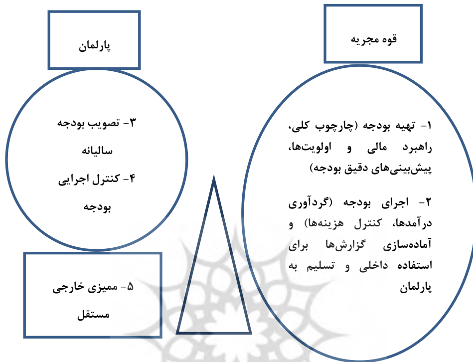
شکل ۲: تقسیم وظایف بین پارلمان و قوه مجریه در چرخه بودجه