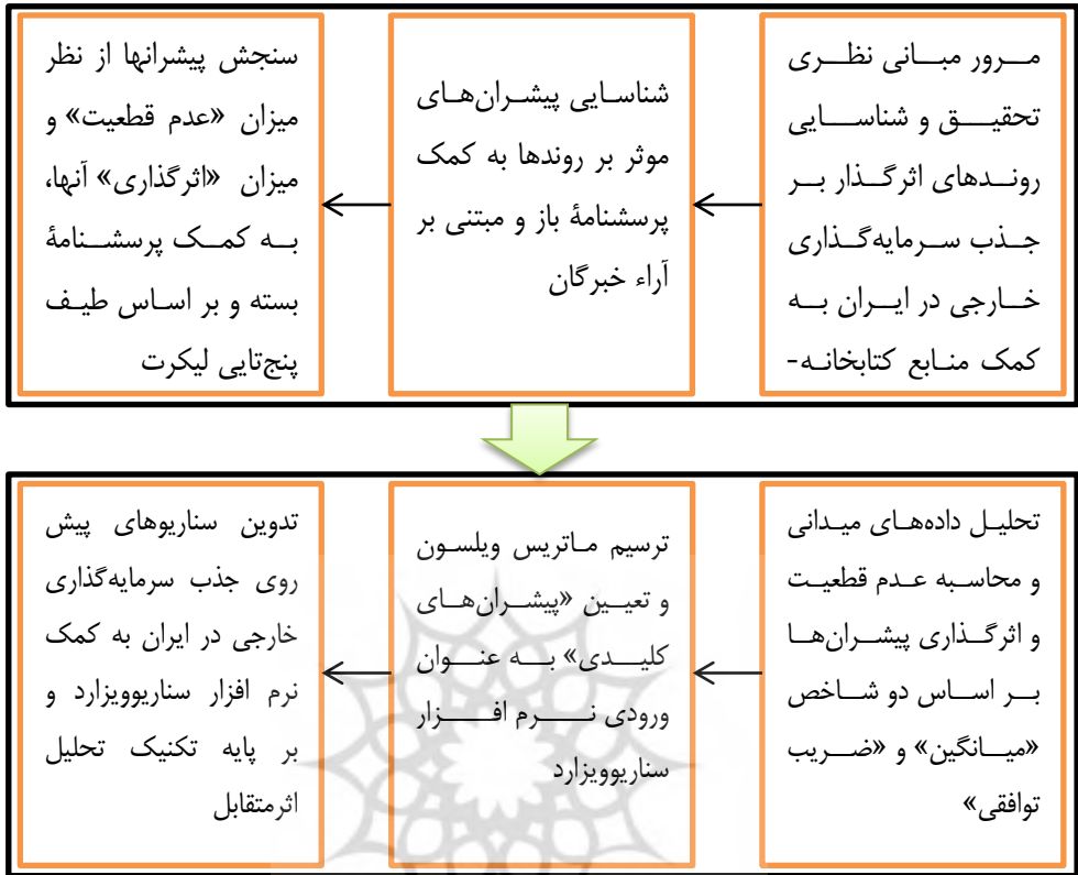
شکل ۱. فرایند کلی تحقیق