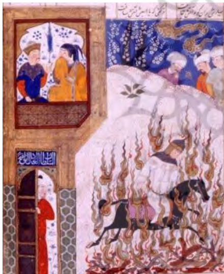
۷. شاهنامه، نسخهٔ ۱۲۰۸۴ محفوظ در کتابخانهٔ بریتانیا، مورخ ربیع الاول ۹۷۲