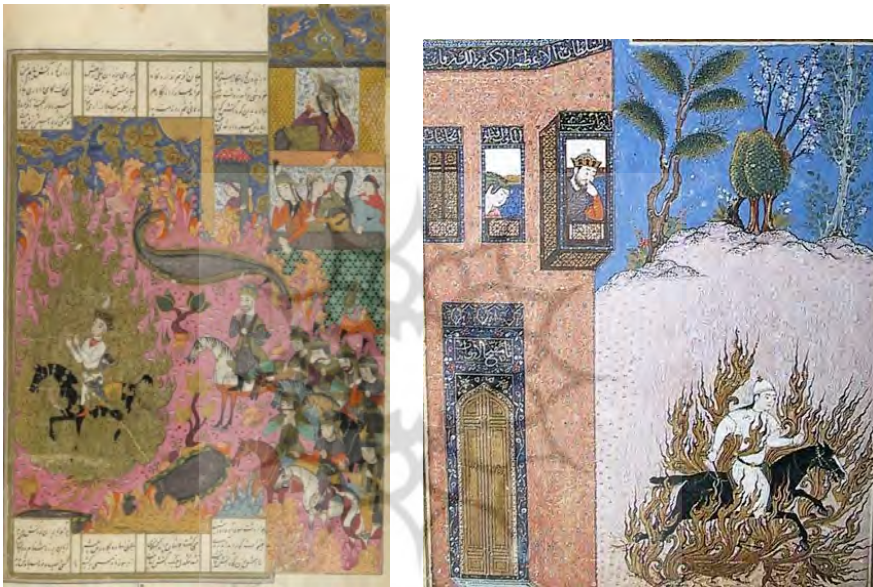
۱۲- شاهنامه جوکی، محفوظ در کتاب‌خانهٔ بریتانیا، مکتب هرات، دورهٔ تیموری

ایوان کاخ به تماشا ایستاده‌است که همانا سودابه است (تصویر ۱۲). در نسخهٔ مورخ ۷۳۰ ق محفوظ در موزهٔ توپقاپی، رنگ و طرح جامهٔ سودابه بسیار شبیه جامهٔ کاووس است. گاه سودابه نه در ایوان کاخ بلکه در نزدیکی خرمن آتش و در کنار کاووس ایستاده و گاه نیز از گذر پیروزمندانه سیاوش از آتش هراسان و در حال روی خراشیدن است. همهٔ این‌ها گواه است که نگارگر پای‌بندی به متن را سرلوحه قرار داده و حتّاً از ترسیم سودابه که منفورترین زن شاهنامه است نیز شانه خالی نکرده‌است. کاووس با تاج و لباس شاهانه سوار بر اسب در کنار خرمن آتش ایستاده و انگشت تعجب به دهان گرفته‌است و گاه خیل درباریان و سپاهیان همراه او به‌تصویر درآمده‌اند (تصویر ۱۳).