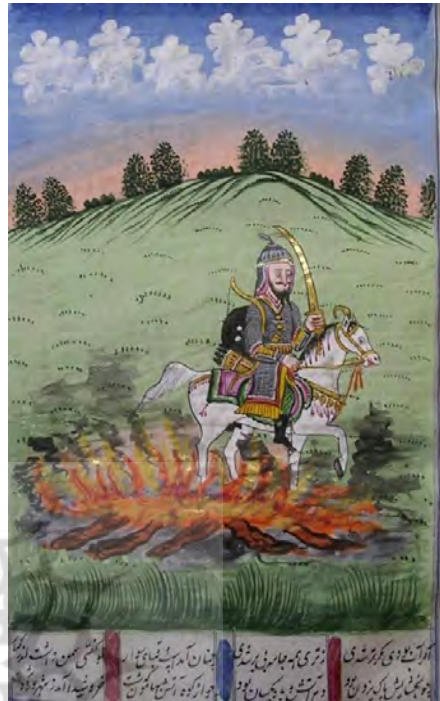
اسب سپید سیاوش

۱۹. نسخهٔ ۵۹ محفوظ در کتابخانهٔ فری فیلادلفیا مورخ ۱۶ شعبان ۱۲۴۴، مکتب کشمیر