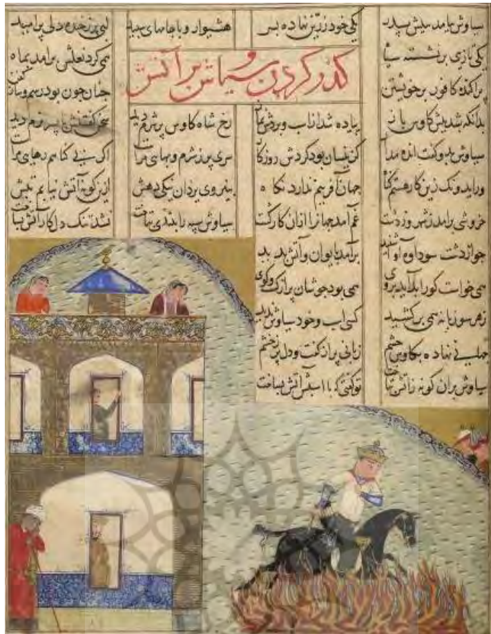
۱۴- حذف شخصیت‌های فرعی، نسخهٔ ۱۲۶۸۸ محفوظ در کتاب‌خانهٔ بریتانیا، مورخ ۱۱ محرم ۸۵۰، مازندران، تیموری