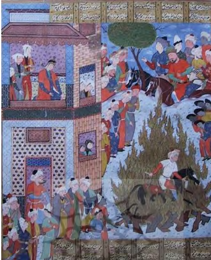
۱- شاهنامه، نسخهٔ شماره ۱۹۸۳ محفوظ در موزهٔ ترک و اسلام استانبول، مورخ ۱۵۹۰م، مکتب شیراز