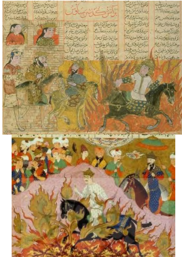
سیاوش با جامه سپید و خود زرین

۲. شاهنامه کوچک، مورخ ۷۳۱ ق، محفوظ در موزه تویقاپی استانبول