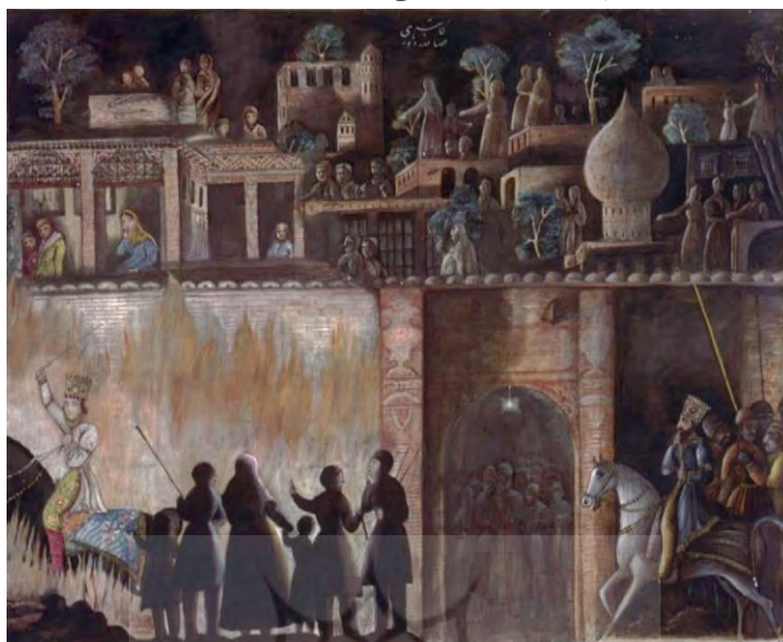
۲۲. گذر سیاوش از آتش، شاهنامهٔ داوری، دورهٔ قاجار

نگاره‌های این مجلس، مردم عادی ترسیم نشده‌اند، اما شاهنامهٔ داوری که یک شاهنامهٔ مردمی است به حضور مردم در صحنه، توجهی ویژه نشان داده‌است.