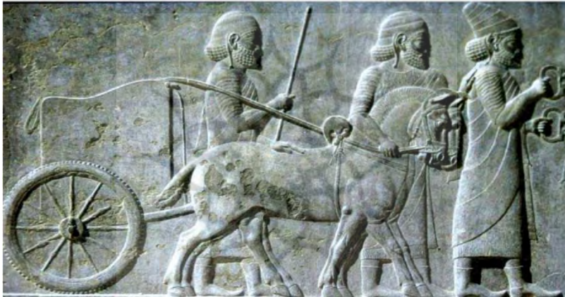
۴. ریتون با طرح اسب، دوره هخامنشی ۵. نقش برجسته اسب در پلکان شرقی آپادانا، ۶-۵ پ.م

در کهن‌ترین نمونه‌های تصویری، اسب سیاوش سیاه است. مثلاً «در کوزه مرو، متعلق به سده چهارم یا پنجم میلادی، با این که رنگ سیاه اسب با نقوش رنگین کوزه هماهنگی ندارد، اما نگارگر به تبع از اصل روایت، اسب سیاوش را سیاه ترسیم کرده‌است» (حصوری، ۱۳۸۷: ۴۲). در نگاره‌ها لباس سپید سیاوش با اسب سیاه او در کنار هم تضاد رنگی ایجاد کرده‌است (تصاویر ۶-۷-۸-۹).