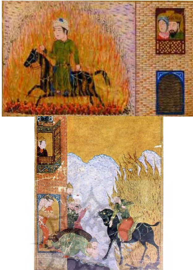
سیاوش با جامهٔ سبز

۱۷. شاهنامه، نسخه ۱۴۰۳ محفوظ در کتابخانه بریتانیا، ۱۱ رمضان ۸۴۱