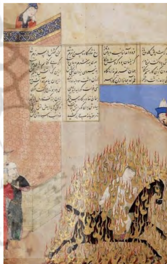
۸. شاهنامه، نسخهٔ شمارهٔ ۱۸۹ محفوظ در گالری آرتور ساکلر واشنگتن، مورخ رجب ۸۴۵