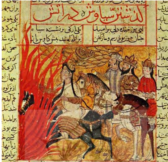
۱۵. شاهنامه مورخ ۷۳۳ محفوظ در کتابخانه عمومی لنینگراد مکتب شیراز

حقانیت سیاوش باشد. چرخش پرنده به عقب و برگرداندن سرش به سوی کسانی که آزمون آتش را برپا کردند می‌تواند مویذ این فرض باشد (تصویر ۱۵). (آدامووا و گیوزالیان، ۱۳۸۳: ۱۲۴).