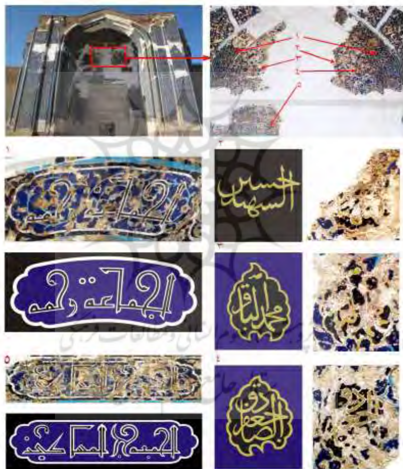
تصویر ۳: کتیبه بالای سردر مسجد کبود و شکل بازسازی شده اجزای آن که توسط نگارندگان کشف و قرائت گردید: ۱- الجماعه رحمه، ۲- حسین الشهید، ۳، محمد الباقر، ۴- جعفر الصادق، ۵- الجمعه حج المساکین، (منبع: نگارندگان)

کتیبه‌ای با خط بنایی متداخل در محراب میان دو فضای صحن و شاه‌نشین قرار دارد که کلمه محمد نوشته شده و سوره‌ی کوثر در داخل آن به اجرا در آمده است. سوره کوثر در شأن امّ‌الائمّه، حضرت فاطمه(س) نازل شده است (تصویر ۲). نام امامین حسن و حسین (ع) نیز زیر مقرنس همین فضا به چشم می‌خورد. این دو نام در تزیینات دیوار جنوبی رواق شمال غربی مسجد نیز به خط بنایی اجرا شده است.