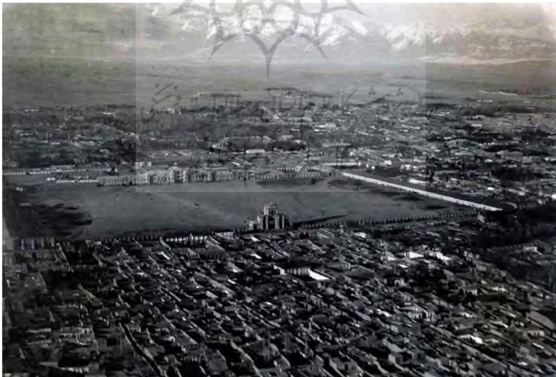
تصویر ۱. میدان مشق تهران پیش از بنای موزه ایران باستان