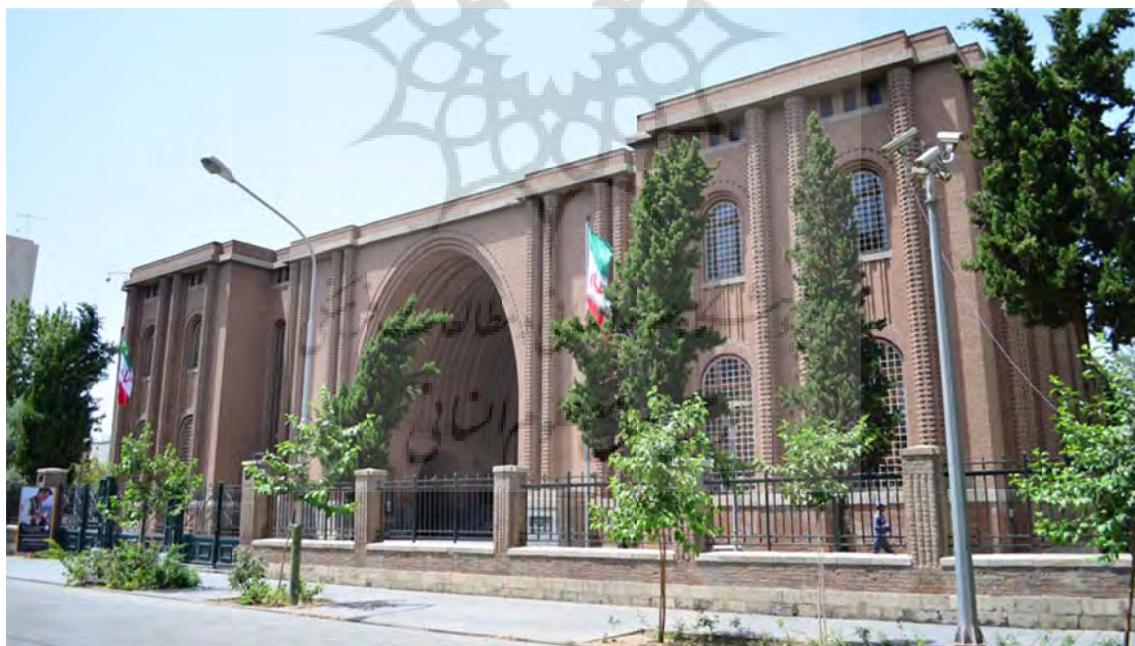
تصویر ۳. موزه ایران باستان امروز