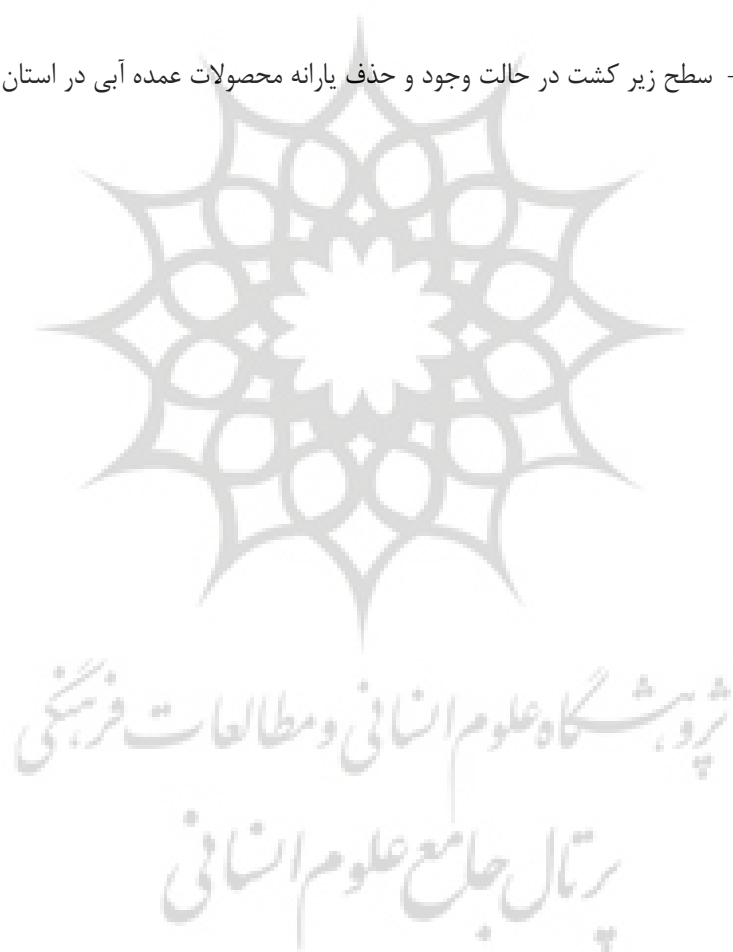
جدول ۲- سطح زیر کشت در حالت وجود و حذف یارانه محصولات عمده آبی در استان خوزستان

سود مناطق مورد مطالعه بیشینه نمی‌باشد. به عبارت دیگر با تخصیص مجدد منابع با توجه به مزیت نسبی و محدودیت منابع در دسترس، می‌توان سود را حداکثر نمود. همچنین سود در حالت عدم وجود تناوب نسبت به حالت وجود تناوب، افزایش یافته است. این امر ممکن است به دلیل حذف و یا کاهش سطح زیر کشت برخی محصولات در تناوب با ذرت، مانند گندم و جو، باشد. این محصولات به دلیل داشتن مزیت نسبی پایین در تولید، در حالت عدم وجود تناوب، توانایی رقابت با محصولات با مزیت نسبی بالا مانند ذرت دانه‌ای و محصولات رقیب آن را ندارند. برای مثال در شهرستان رامشیر در حالت عدم تناوب، محصول جو از الگوی کشت خارج شده و سطح زیرکشت آن به محصول ذرت دانه‌ای اختصاص یافته است. همچنین به منظور بررسی سیاست‌های دولت و تعیین سطح زیر کشت بهینه ذرت دانه‌ای در حالت وجود [بهینه (۱)] و حذف یارانه [بهینه (۲)]، دو مدل برنامه‌ریزی خطی برای هر یک از حالات مذکور با استفاده از قیمت‌های بازاری برآورد گردیده است که نتایج آن در جدول ۲ ارائه شده است.