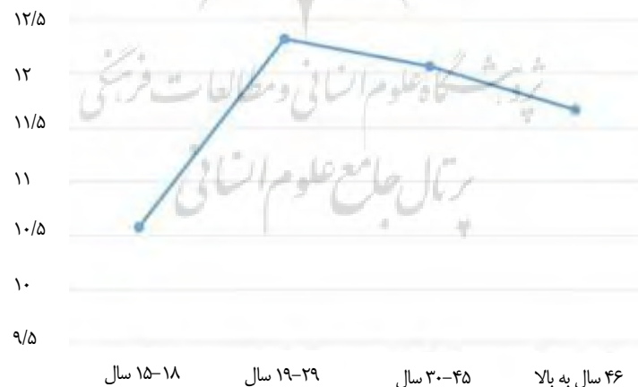
شکل ۱. میانگین نمره‌های عملیات انتزاعی در گروه‌های سنی

همان‌طور که در جدول ۲ آمده است اثر گروه‌های سنی بر نمره‌های عملیات انتزاعی معنادار نبود؛ به عبارتی بین گروه‌ها تفاوت معناداری وجود نداشت و در واقع میانگین نمره‌های عملیات انتزاعی با افزایش سن تغییر معناداری پیدا نمی‌کرد. اثر جنس بر نمره‌های عملیات انتزاعی و همچنین تعامل بین متغیرهای کنترل و متغیر مستقل نیز معنادار نبود. نتیجه مقایسه‌های زوجی در جدول ۳ آمده است.