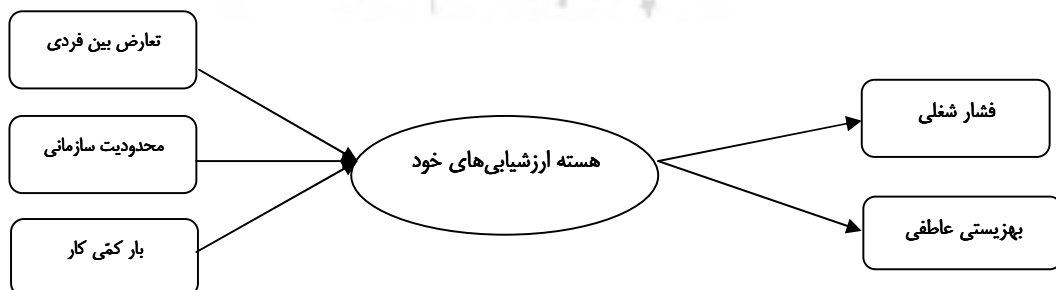
شکل ۱. الگوی پیشنهادی نقش واسطه‌ای رگه‌های هسته ارزشیابی‌های خود

است، اما تاکنون مطالعه‌ای که روابط بین هسته ارزشیابی‌های خود با تنیدگی شغلی، فشار روان‌شناختی و بهزیستی عاطفی مرتبط با شغل را در یک مطالعه واحد نشان دهد، گزارش نشده است. در پژوهش حاضر برای نشان دادن چگونگی ارتباط هسته ارزشیابی‌های خود با فرایند تنیدگی- فشار روان‌شناختی و بهزیستی عاطفی، یک الگوی پیشنهادی ارائه شده است (شکل ۱). این الگو نشان می‌دهد که چگونه خلق فرد بر ادراک و واکنش وی نسبت به محیط کاری تأثیر می‌گذارد. بر مبنای ادبیات پژوهشی، در این پژوهش هسته ارزشیابی‌های خود به عنوان یک متغیر واسطه‌ای در نظر گرفته شده است که در ادراک عوامل تنیدگی‌زا، فشار شغلی و بهزیستی عاطفی نقش اساسی دارد. برای دستیابی به هدف پژوهش حاضر، نخست صحت و تأیید این پیش‌بینی که سازه هسته ارزشیابی‌های خود از رگه‌های حرمت‌خود، خودکارآمدی، مسند مهارگری و نوروزگرایی تشکیل یافته است (برای مثال، ارز و جاج، ۲۰۰۱؛ استامپ و دیگران، ۲۰۰۹؛ بونو و جاج، ۲۰۰۳؛ بیپ، ۲۰۱۰؛ جاج، بونو، ارز و لاک، ۲۰۰۵؛ جاج، بونو و لاک، ۲۰۰۰؛ جاج و لارسن، ۲۰۰۱؛ جاج و دیگران، ۲۰۰۲؛ جاج و دیگران، ۲۰۰۳؛ جاج و کامیر- مولر، ۲۰۱۲؛ رادل، جاج و سان، ۲۰۱۲؛ هیلر و کمبریک، ۲۰۰۵)، بررسی شد. سپس به منظور آشکار شدن نقش واسطه‌ای رگه‌های هسته ارزشیابی‌های خود در رابطه بین عوامل تنیدگی‌زای شغلی، فشار شغلی و بهزیستی عاطفی، این فرض که عوامل تنیدگی‌زای شغلی بر فشار شغلی به طور مثبت و بر بهزیستی عاطفی به طور منفی اثر مستقیم و اثر غیرمستقیم دارند، آزمون شد.