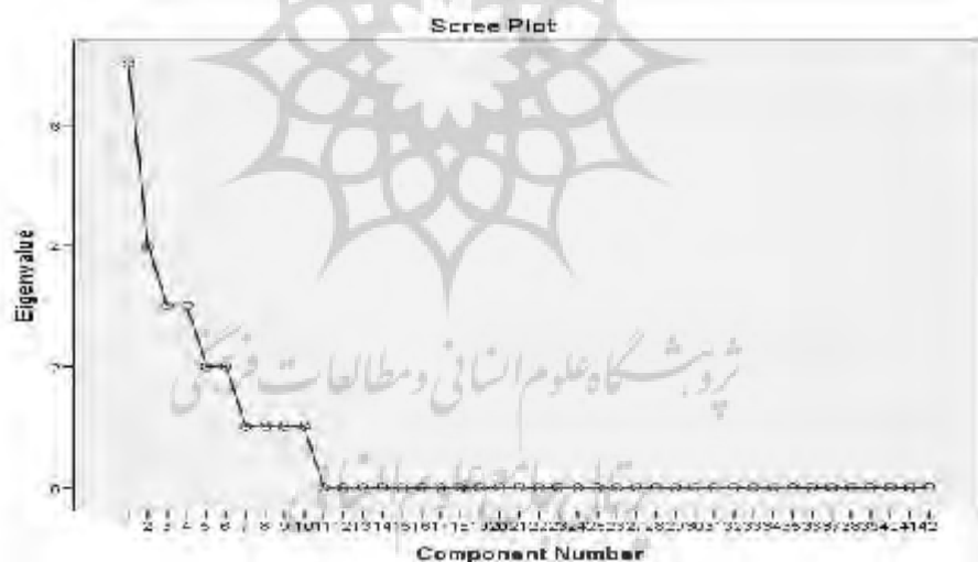
شکل ۱- اسکری یا سنگ‌ریزه عوامل بازاریابی عصبی باشگاه‌های ورزشی