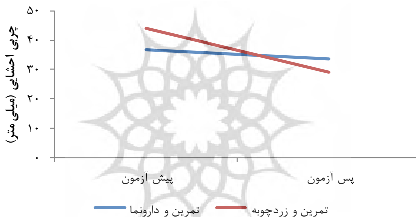
شکل ۱- تغییرات چربی احشایی قبل و بعد از مداخله در دو گروه تمرین- دارونما و تمرین- زردچوبه

از مکمل زردچوبه برای مقادیر چربی احشایی ( F_{1,18} = 10, P = 0.004 ) و چربی شکمی ( F_{1,18} = 12, P = 0.002 )، در پاسخ به شش هفته تمرین تناوبی شدید تعامل معناداری مشاهده شد. مشاهده شکل یافته‌های پژوهش کاهش بیشتر چربی احشایی (شکل شماره یک) و چربی شکمی (شکل شماره دو) را در گروه تمرین- زردچوبه نسبت به گروه تمرین- دارونما نشان می‌دهد؛ ولی تعامل معناداری بین استفاده یا استفاده‌نشدن از مکمل زردچوبه برای مقاومت انسولین ( F = 0.63, P = 0.43 )، در پاسخ به شش هفته تمرین تناوبی شدید مشاهده نشد؛ اما اندازه اثر کوهن ۱ برای مقاومت انسولین در گروه تمرین- زردچوبه ( d = 4.69 ) بیشتر از گروه تمرین- دارونما ( d = 4.48 ) بود.