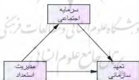
شکل ۱. مدل مفهومی تحقیق

با توجه به شناخت ناکافی از وضعیت موجود سیستم مدیریت استعداد در ادارات ورزش و جوانان و نبود دانش کافی در زمینه ارتباط آن با سرمایه اجتماعی و تعهد سازمانی از یک سو و تحقیقات محدود در این حوزه که بیشتر این تحقیقات هم در سازمان‌های غیرورزشی به انجام رسیده‌اند و از سوی دیگر برای سنجش متغیرهای مذکور نیز از الگوهای مفهومی قدیمی و متفاوتی استفاده شده است، از این رو انجام پژوهشی که هدف آن بررسی ارتباط مدیریت استعداد با سرمایه اجتماعی و تعهد سازمانی در ادارات ورزش و جوانان استان کرمان باشد، اهمیت خاصی دارد. این پژوهش براساس الگوی مفهومی (شکل ۱) طراحی شده است. این الگو از سه متغیر تعهد سازمانی کارکنان به‌عنوان متغیر ملاک و سرمایه اجتماعی به‌عنوان متغیر میانجی و مدیریت استعداد به‌عنوان متغیر پیش‌بین الگو تشکیل شده است.