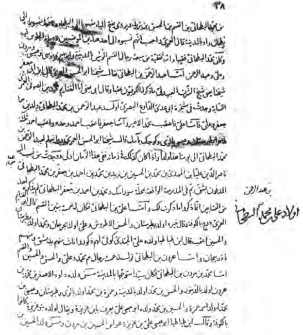
تصویر صحیح‌ترین و کهن‌ترین نسخه خطی عمده الطالب در کتابخانه مسجد اعظم قم که مدفن امام ناصرالدین را در قم ضبط کرده است نه قم.

او نخستین سید حسینی است که به قم آمد. ۴۲