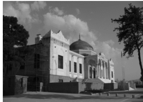
تصویر ۱- موزه مردم شناسی، اثر عاریف حکمت بیک، آنکارا،