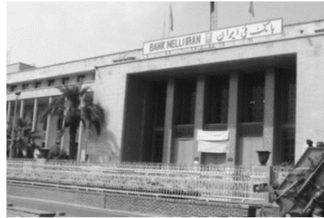
تصویر ۳- بانک ملی ایران، بازار تهران