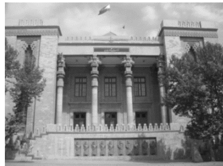
تصویر ۵- کاخ شهربانی (وزارت امور خارجه فعلی)، تهران