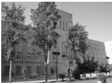
تصویر ۶- وزارت امور خارجه، اثر گابریل گورکیان، تهران (ماخذ: ج. سهیلی، ۱۳۸۹)

۲- موزه ایران باستان، اثر آندره گدار، تهران، ۱۳۱۴-۱۳۱۲