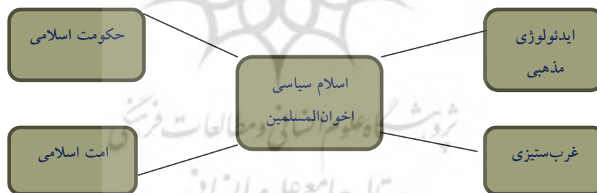
شکل ۲. مفصل‌بندی گفتمان اسلام‌گرای اخوان‌المسلمین

مسلمانان باید بی‌آنکه اصول خود را رها کنند، خود را با زمان تطبیق دهند و عقل خدادادی را در همه کارها به‌کار اندازند؛ توجه به خلافت، زیرا بهترین نوع حکومت، خلافت الهی است نه جمهوری یا سلطنتی، آنان در اینجا به‌مانند خوارج و تا حدودی رشیدرضا اعتقاد دارند که لازم نیست خلیفه قریشی باشد، هرکسی لایق و مردم‌پسند باشد و از احکام الهی پیروی کند، مردم باید از او اطاعت کنند (رجایی، ۱۳۸۱: ۳۵)؛ تعامل با فرقه‌های مسلمان و اجتناب از جدال‌ها و درگیری‌های فرقه‌ای، ضدیت با اسرائیل و حمایت از مقاومت فلسطین (محمودیان، ۱۳۹۱: ۱۰۵-۱۱۷). اخوان‌المسلمین از سال‌های اولیه شکل‌گیری دارای اهداف گفتمانی کسب قدرت بوده است؛ گفتمانی که دال مرکزی آن را «اسلام سیاسی» تشکیل داده و دال‌های نظیر مردم، ایدئولوژی، اتحاد مسلمانان، حکومت اسلامی، ضدیت با اسرائیل و حمایت از فلسطین، حول دال مرکزی اسلام شکل گرفته است. گفتمان اخوان را به‌مدت پنجاه سال، گفتمان سکولار و ملی‌گرای حسنی مبارک سرکوب کرد و به‌حاشیه راند. گفتمان «ملی‌گرای سکولار» مبارک بر اساس دال‌های جدایی دین از سیاست، استبداد، رابطه با غرب، حمایت از اسرائیل شکل گرفته بود. در مدتی که گفتمان ملی‌گرا حاکم بود، اخوان‌المسلمین غیر آن شناخته می‌شد و طرد آن، اولویت اول حکومت حسنی مبارک بود. اما از آنجا که هیچ گفتمانی برای همیشه سرکوب شده نمی‌ماند، گفتمان اسلام‌گرای اخوان منتظر فرصت بود تا قابلیت دسترسی پیدا کرده، خود را هژمون سازد. این فرصت با ایجاد بحران در گفتمان ملی‌گرای سکولار ایجاد شد و با تشدید بحران اجتماعی و کودتای نظامیان به‌حاشیه رفت.