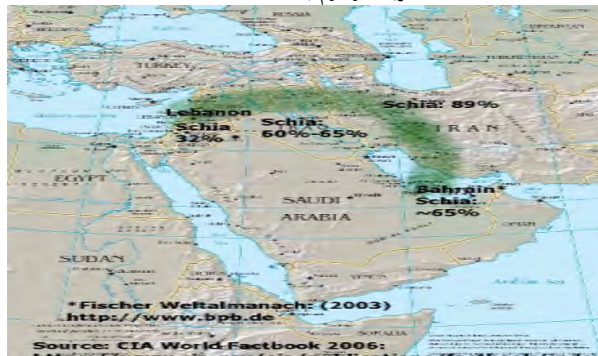
کمربند موسوم به هلال شیعه

شیعیان در خاورمیانه در یک کمان استراتژیک با عنوان هلال شیعه واقع شده‌اند که از لبنان شروع و تا یمن در پایین عربستان امتداد پیدا می‌کند. این بخش‌ها سواحل شمالی و جنوبی خلیج فارس را شامل می‌شود و بخش‌هایی از جنوب سواحل عراق، کویت، استان‌های شرقی عربستان سعودی (احساء، قطیف)، سواحل بحرین و قسمت‌هایی از سواحل قطر و بندر دبی در امارات متحده عربی را دربر می‌گیرد. در واقع، به لحاظ جغرافیایی مهم‌ترین بخش‌های خاورمیانه و بخصوص خلیج فارس در اختیار شیعیان است و به تعبیر فرانسوا توال خلیج فارس از نظر جغرافیای مذهبی تحت سلطه شیعیان است و یا به قول نوام چامسکی که گفته بود: «از سر یک تصادف جغرافیایی منابع اصلی نفت جهان عمدتاً در مناطق شیعه‌نشین خاورمیانه یعنی جنوب عراق، مناطق شرق عربستان و ایران قرار دارد» (Chomsky, 2007, 85). میدان نفتی "رومیله" در جنوب عراق با تولید روزانه ۲ میلیون بشکه نفت خام، منطقه "بورگان" در جنوب کویت محل بارگیری نفت خام استخراج‌شده از میدان نفتی بورگان با تولید روزانه ۱.۷ میلیون بشکه، ابرمیدان نفتی "قوار" عربستان با تولید روزانه ۵ میلیون بشکه در روز، همه در مناطق شیعه‌نشین کشورهای یادشده می‌باشند.