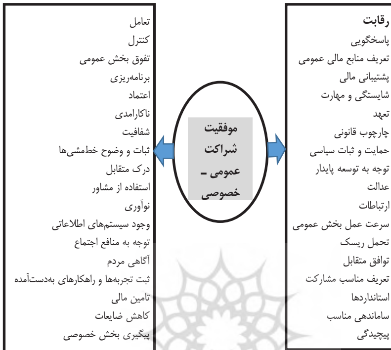
شکل ۱: مدل مفهومی پژوهش