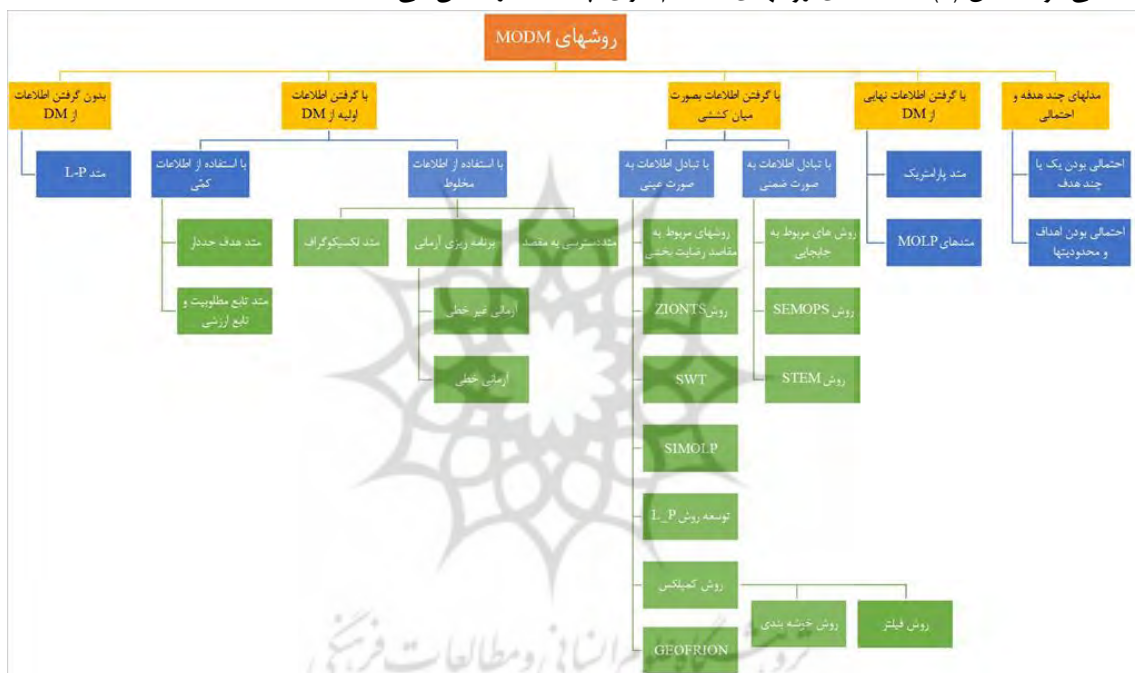
شکل شماره (۱): ارزیابی یک تصمیم‌گیری چندهدفه در یک تقسیم بندی کلی MODM

در این مدل‌های تصمیم گیری چندین هدف به طور همزمان جهت بهینه شدن، مورد توجه قرار می گیرند. مقیاس سنجش برای هر هدف ممکن است با مقیاس سنجش برای بقیه اهداف متفاوت باشد. مثلاً یک هدف حداکثر کردن ظرفیت تولید است که بر حسب واحد کمی مقدار سنجیده می‌شود و هدف دیگر حداقل استفاده از انرژی است که بر حسب مقدار مصرف انرژی در ساعت سنجیده می‌شود. شکل (۱) طبقه بندی روشهای تصمیم‌گیری چندهدفه را نشان می دهد.