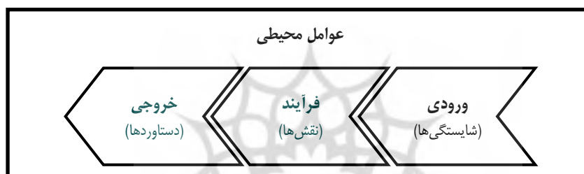
شکل ۱. الگوی جامع ارزیابی عملکرد (Wang, 2009)

عملکرد در بخش عمومی، مفهوم مبهم، چندبُعدی و پیچیده‌ای است (Talbot, 2010)؛ اما ارزیابی عملکرد رهبران دولت، فراتر از آن است. نامزدهای سیاسی را می‌توان به‌سادگی بر اساس اقبال‌های انتخاباتی و رهبران احزاب را علاوه‌برآن، بر اساس انسجام و قوت سازمان حزب ارزیابی کرد؛ اما چگونه می‌توان رهبری سران دولت، مانند وزیران را به‌طور نظام‌مند ارزیابی کرد؟ (t Hart & Schelfhout, 2016). جالب‌توجه است که علی‌رغم اهمیت جایگاه وزیران، مطالعات درباره آن‌ها، توجه کمی را به خود جلب کرده و می‌توان گفت مطالعه وزیران و حرفه وزارت در دوران طفولیت است (Drabble, 2011; Cheong, 2009; Kocijan, 2014). در مبنای نظری از سه رویکرد به ارزیابی عملکرد یاد شده است: ۱. رویکرد مبتنی بر ورودی‌ها (ویژگی‌های شخصی)؛ ۲. رویکرد مبتنی بر فرآیندها (رفتارها) و ۳. رویکرد مبتنی بر خروجی‌ها (نتایج) (Rasouli & Salehi, 2016)؛ اما در کنار این سه رویکرد، عوامل محیطی و خارج از دسترسی نیز وجود دارد که عمیقاً در آن‌ها اثر می‌گذارد (شکل ۱).