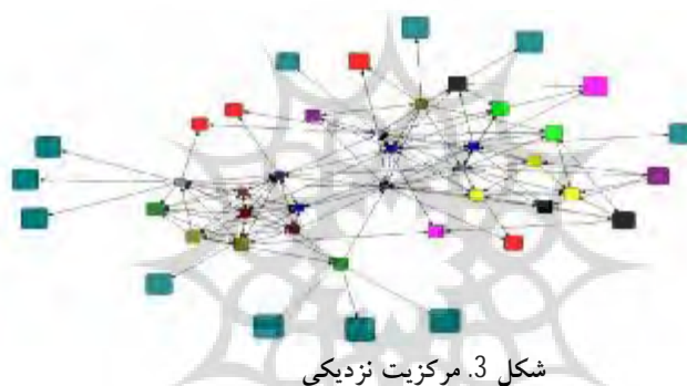
شکل 3. مرکزیت نزدیکی

همان‌گونه که در شکل 3 ملاحظه می‌شود، کنشگران با بالاترین مرکزیت نزدیکی در شبکه شناسایی شدند. این کنشگران در موقعیتی در شبکه دانش قرار دارند که به سایر گره‌ها سریع‌تر دسترسی پیدا می‌کنند، بنابراین دانش دست‌اول‌تر را به سرعت و بدون واسطه و یا با واسطه کمتری دریافت می‌کنند. بالاترین حد مرکزیت نزدیکی با شاخص عدد 3/472 و پایین‌ترین حد مرکزیت نزدیکی با شاخص عددی 1/961 به دست آمد. جدول 5 شاخص‌های عددی مرکزیت نزدیکی را برای کنشگران فعال در شبکه نشان می‌دهد. میانگین مرکزیت نزدیکی برای کنشگران 3/026 ، انحراف استاندارد 0/464 و واریانس 0/125 می‌باشد.