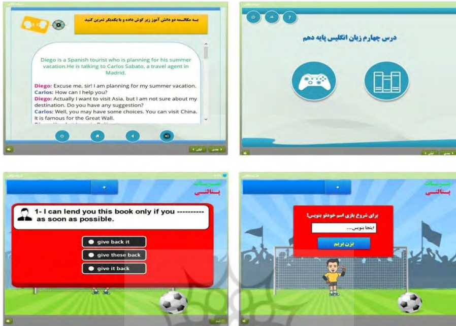
شکل ۱. نمایی از بازی رایانه‌ای تولید شده

همان‌طور که گفته شد، بازی رایانه‌ای تولید شده شامل دو بخش آموزش و بازی است که بخش آموزش که به صورت چند رسانه‌ای (متن، تصویر، صوت و ویدئو) و متناسب با سرعت یادگیرنده و ویژگی‌های متغیر خود تنظیمی تحصیلی تهیه شده، در شکل شماره ۲ قابل مشاهده است: