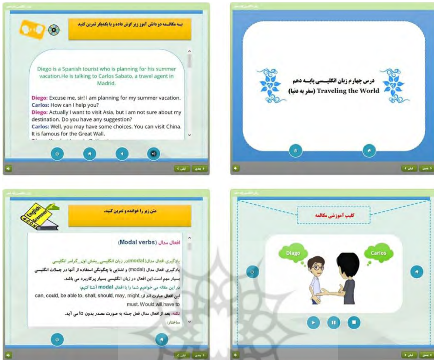
شکل ۲. نمای از قسمت آموزشی بازی رایانه‌ای تولید شده

حین و در پایان گذراندن بازی و انجام آزمون بازخوردهایی به دانش‌آموزان بر اساس ویژگی‌های متغیر خودتنظیمی تحصیلی داده می‌شد که بدان‌ها اشاره شد در شکل شماره ۳ نمایی از این بازخوردها قابل مشاهده است: پرتال جامع علوم انسانی