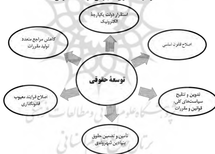
نمودار ۲. الگوی مفهومی توسعه حقوقی