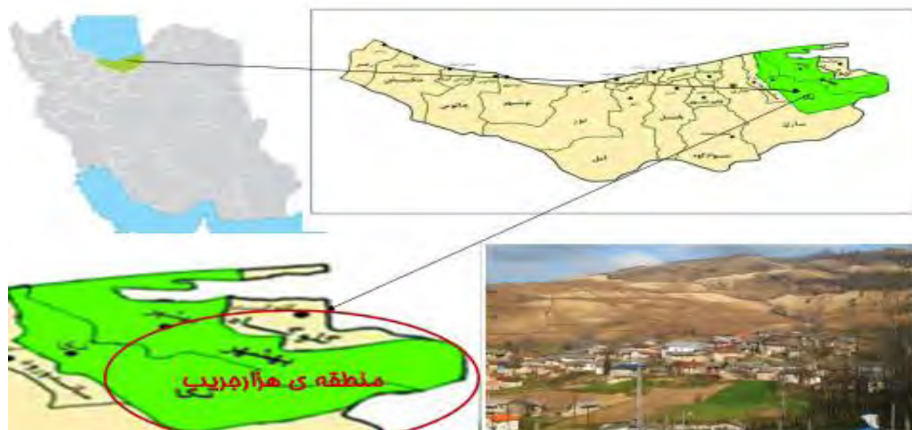
شکل (۲) منطقه‌ی هزار جریب شهرستان‌های بهشهر و نکا

مطابق اطلاعات جدول شماره (۱) شهرستان بهشهر در منطقه کوهستانی هزارجریب دارای دو بخش یانسر و مرکزی و سه دهستان به نام های شهدا، عشرستاق و پنج هزاره است که دارای ۶۲ آبادی و ۱۵۴۴۴ نفر جمعیت است. شهرستان نکا نیز در منطقه کوهستانی هزارجریب دارای دو بخش هزارجریب و مرکزی و سه دهستان به نام های زارم رود و استخر پشت و پی رجه می باشد که دارای ۸۶ روستا و جمعیت ۲۶۴۳۴ نفر است. کل جمعیت منطقه هزار جریب شهرستان بهشهر و نکا ۴۱۸۷۸ نفر است. جامعه‌ی آماری این تحقیق کل بهره برداران (۵۲۵۰ بهره بردار زراعی و باغی) در اراضی شیب‌دار منطقه هزارجریب شهرستان‌های بهشهر و نکا است که با استفاده از روش نمونه گیری طبقه‌ای تصادفی و خطای ۷/۵ درصد تعداد ۱۲۰ کشاورز بر اساس رابطه شماره (۱) به عنوان نمونه انتخاب گردید که اطلاعات لازم از طریق تکمیل تعداد ۶۰ پرسشنامه از ۶۲ آبادی شهرستان بهشهر و ۶۰ پرسشنامه از ۸۶ آبادی شهرستان نکا مطابق جدول شماره (۱) جمع آوری گردید.