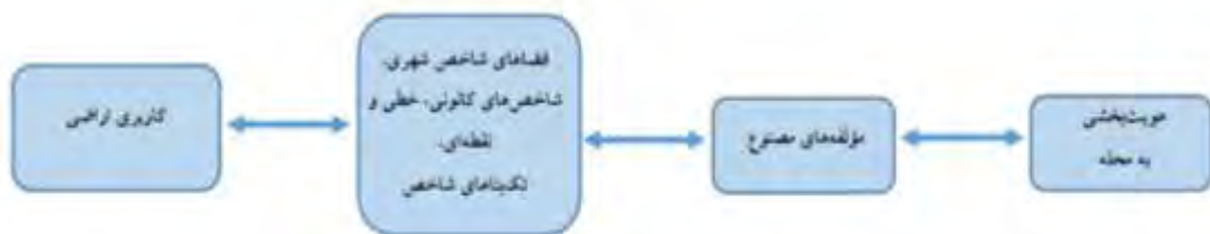
نمودار ۱. شاخص‌ها و متغیرهای تحقیق