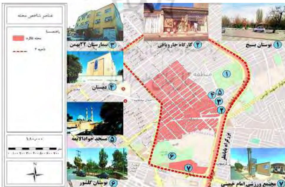
شکل ۳. عناصر شاخص محله تلگرد مأخذ: (یافته‌های پژوهش)