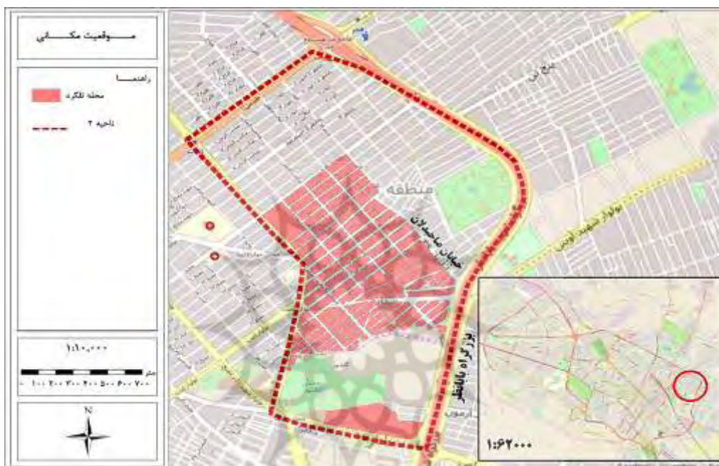
شکل ۱. موقعیت محدوده مورد مطالعه محله تلگرد