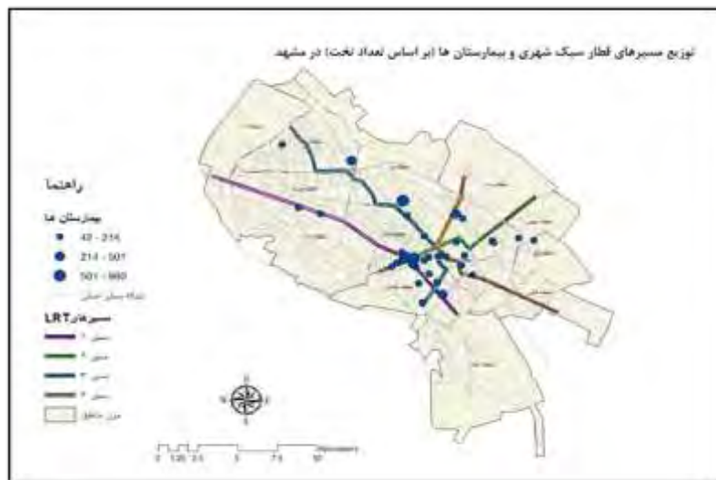
شکل ۱. توزیع مسیرهای LRT و بیمارستان‌ها در سطح شهر مشهد

این پژوهش گروه‌های درآمدی شهر مشهد در قالب ۵ طبقه از درآمد بسیار کم تا درآمد بسیار بالا دسته‌بندی شده‌اند. شکل ۱ و جدول ۳، نحوه پراکندگی گروه‌های مذکور را در سطح نواحی و همچنین سهم جمعیت هر گروه درآمدی از کل جمعیت شهر را نشان می‌دهند.