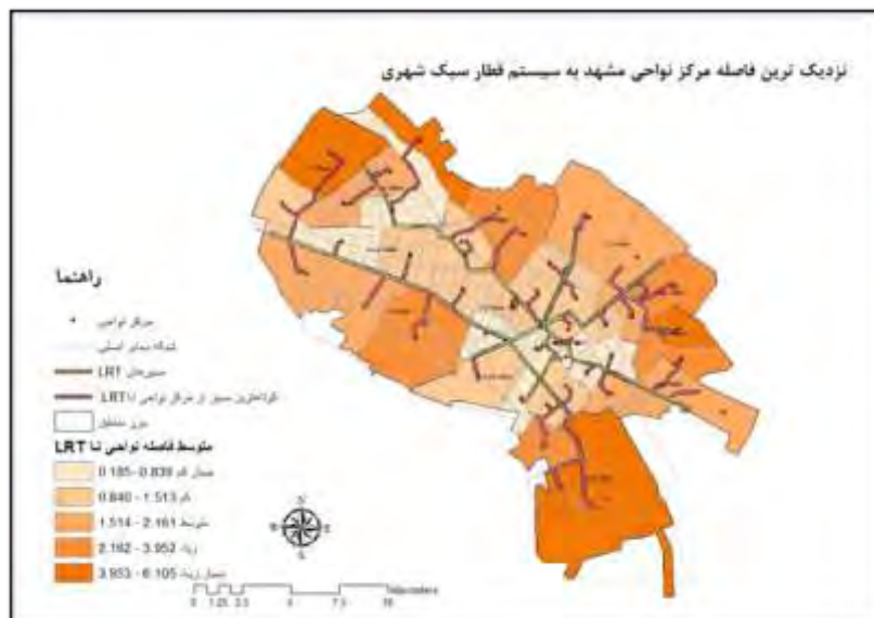
شکل ۳. نزدیک ترین فاصله مرکز نواحی مشهد به سیستم قطار سبک شهری (بر حسب کیلومتر)

مجموع جمعیت شهر ۳۱/۰۳ درصد در فاصله زیاد و بسیار زیاد (+۸۰۰ - ۶۰۱ متر) از نزدیکترین ایستگاه-های LRT واقع می‌شوند که بیشتر مشمول گروه درآمدی متوسط (۳۰/۴۲ درصد جمعیت این گروه در فاصله زیاد) و گروه درآمدی کم (۳۰/۴۴ درصد جمعیت این گروه در فاصله بسیار زیاد) می‌گردند. جدول ۳، سهم گروه‌های درآمدی از فاصله تا نزدیکترین ایستگاه LRT را نشان می‌دهد.