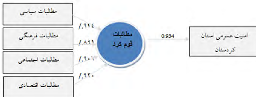
شکل شماره (3). نمودار مطالبات قوم کرد.