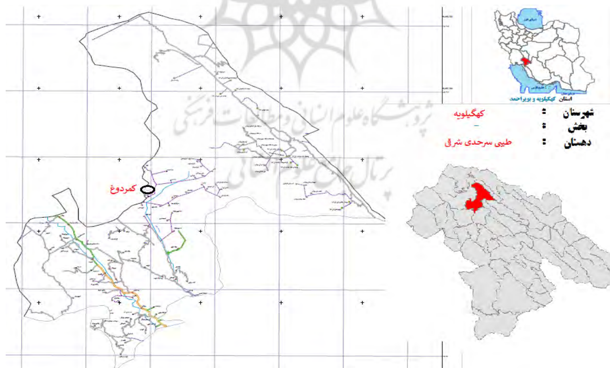
شکل - ۲: نقشه روستای گردشگری کمردوغ

کمردوغ، روستایی در ۱۷ کیلومتری شهر قلعه رئیسی و واقع در دهستان طیبی سرحدی شرقی در بخش چاروسا، شهرستان کهگیلویه از استان کهگیلویه و بویراحمد است که موقعیت آن در شکل (۲) نشان داده شده است. نام این روستا برگرفته از آبشاری به همین نام است. آبشار کمردوغ در فاصله ۸۰ کیلومتری شهر دهدشت مرکز شهرستان کهگیلویه و در کنار روستای کمردوغ واقع شده که به واسطه آب سفیدرنگش به کمردوغ (کمردو) معروف است و در طول سال به ویژه در فصل بهار و تابستان پذیرای گردشگران و مسافرانی از سراسر ایران است. این آبشار دیدنی که نزدیک به ۱۰۰ متر ارتفاع و بیش از ۶۰ متر عرض دارد، پس از عبور از جاده‌های پرپیچ و خم زیبا و درختان و جنگل‌های رؤیایی بلوط و شهر دهدشت نمایان می‌شود.