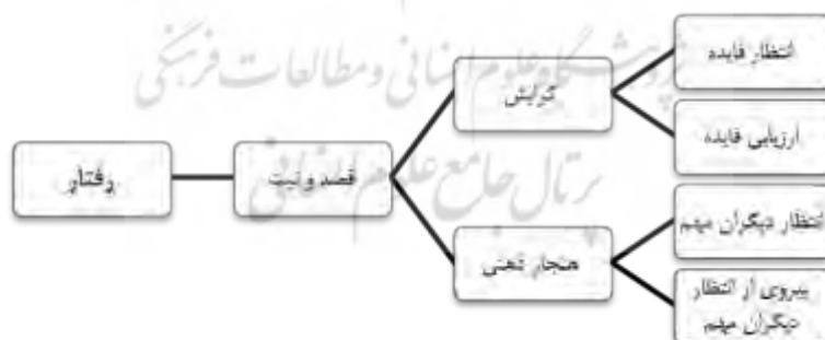
شکل ۶- شکل‌گیری رفتار طبق نظریه فیش باین و آیزن

از آنجا که مشارکت نوعی کنش محسوب می‌شود، تبیین آن هم در قالب نظریات مرتبط با کنش امکان‌پذیر است. برخی از نظریه‌ها برای شناخت و تبیین مشارکت اجتماعی بر تمایل، انگیزه، گرایش و رفتار مشارکت تأکید داشته و برخی دیگر زمینه‌ها، شرایط و عناصر ساختاری مشارکت را محور قرار داده‌اند. نظریه کنش موجه یا معقول فیش باین و آیزن ۱ (۱۹۹۰) از تئوری‌های برجسته رفتار اجتماعی است که روی متغیرهای فردی و روان‌شناختی - اجتماعی در تبیین رفتارهای اجتماعی تأکید دارند. به عقیده آن‌ها رفتار در حالتی قابل پیش‌بینی و قابل درک خواهد بود که ما به قصد شخص در رفتار و در شرایط خاصی توجه کنیم و فقط نگرش‌های او را نسبت به آن رفتار مورد توجه قرار ندهیم. الگوی آنان نشان می‌دهد که قصد‌ها به نگرش‌ها و هنجارهای مرتبط با رفتار متکی است. هنجارها در حکم قواعد رفتار یا شیوه‌های خاص عمل است (محسنی، ۱۳۷۹، به نقل از میرعباسی و حسن پور، ۱۳۸۹، ص. ۵). در این تئوری، گرایش‌ها، به طور مستقیم بر رفتار تأثیر ندارند، بلکه گرایش‌ها بر نیت ما تأثیر می‌گذارند و این نیت است که رفتار ما را شکل می‌دهند (اوری ۲ ، ۲۰۰۰، ص. ۱۹۷). به عبارتی بر اساس این تئوری، رفتار، تابع قصد و نیت است و قصد و نیت به رفتار، خود تابع، گرایش به سوی آن رفتار (تابع انتظار فایده و ارزیابی فایده) و هنجار ذهنی (تابع انتظارات افراد مهم یا انتظارات دیگران و انگیزه برای پیروی از انتظارات دیگران) است (رفیع پور، ۱۳۷۲، به نقل از میرعباسی و حسن پور، ۱۳۸۹، ص. ۵).