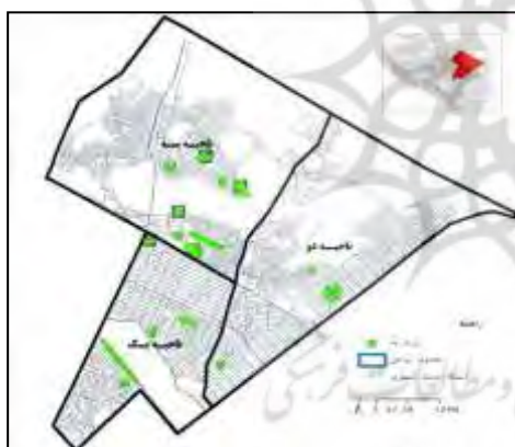
شکل ۴- موقعیت پارک‌ها در منطقه ۳