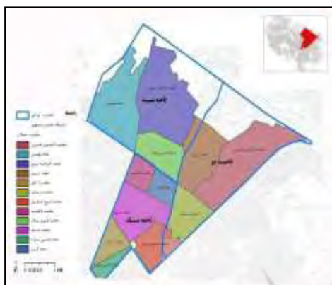
شکل ۲- محدوده محلات در منطقه ۳

افشار متوسط و کم درآمد شهری را مختل نموده است (طرح جامع توسعه و عمران کلان‌شهر مشهد، ۱۳۸۶). موقعیت منطقه سه در شهر مشهد در اشکال ۱ تا ۴ نشان داده شده است.