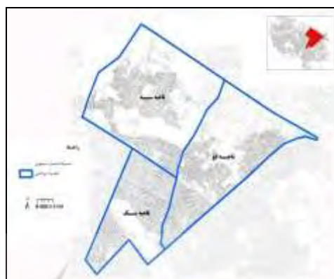
شکل ۱- موقعیت منطقه ۳ در شهر مشهد